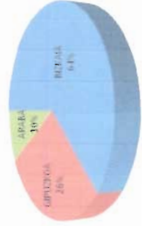
Establecimientos adheridos por Territorio Histórico