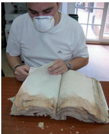
Investigación de archivos

En este contexto, con la declaración efectuada por el Lehendakari Juan José Ibarretxe en fecha 10 de Diciembre de 2002, el Gobierno Vasco puso en marcha una política activa de recuperación de la Memoria Histórica. En el año 2003 y mediante la intervención experta de la Sociedad de Ciencias Aranzadi, la Dirección de Derechos Humanos puso en marcha un plan de investigación sobre las personas represaliadas, fusiladas y desaparecidas en la Guerra Civil, la del Gobierno Vasco.