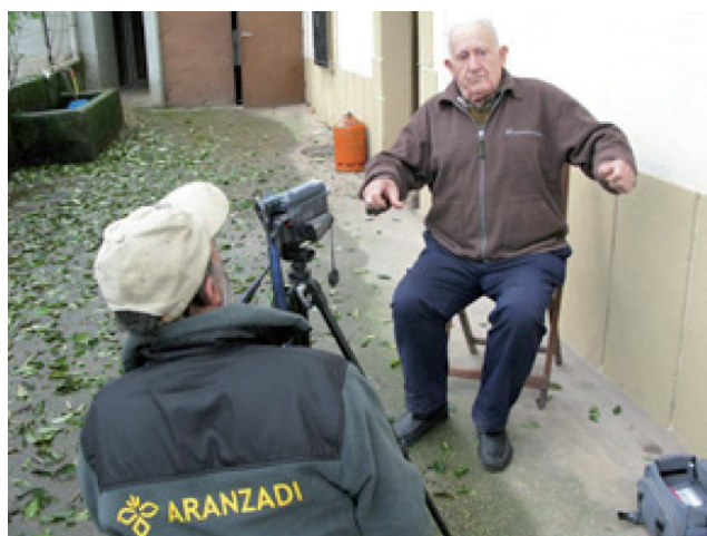
Recogida de testimonios

Todo ello, representa un compromiso y una responsabilidad que el Gobierno Vasco asume con los derechos de las víctimas. Este compromiso y esta responsabilidad se plasman en hechos concretos: avanzar en el proceso de exhumaciones para la búsqueda e identificación de personas desaparecidas.