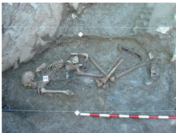
Exhumaciones - Elgeta

Con posterioridad, dicho documento técnico será complementado con el correspondiente informe de análisis de los restos encaminado a la identificación de los mismos y a la determinación de las causas de su muerte, que será realizado en los laboratorios especializados en la materia.