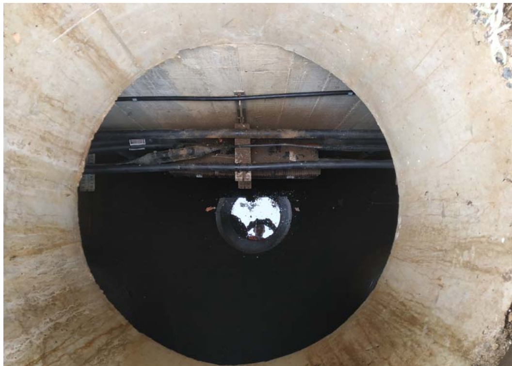
Fotografía 21. Cámara de Telefónica junto al acceso actual al apeadero