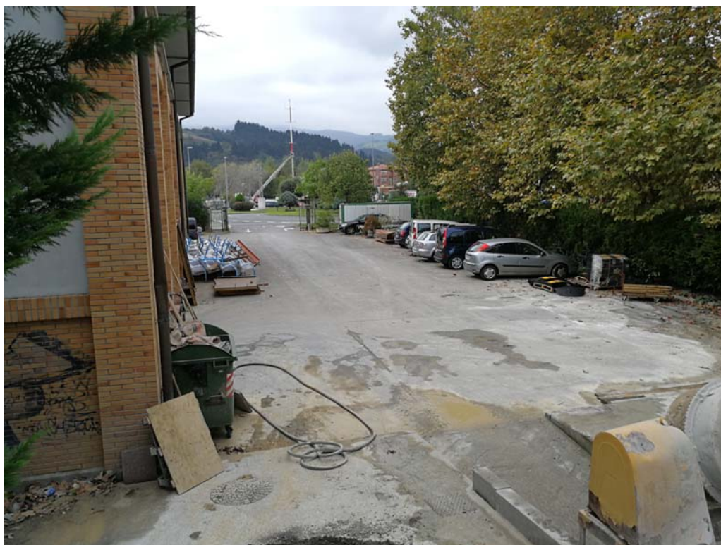
Fotografía 15. Explanada y aparcamiento de la parcela de la brigada municipal