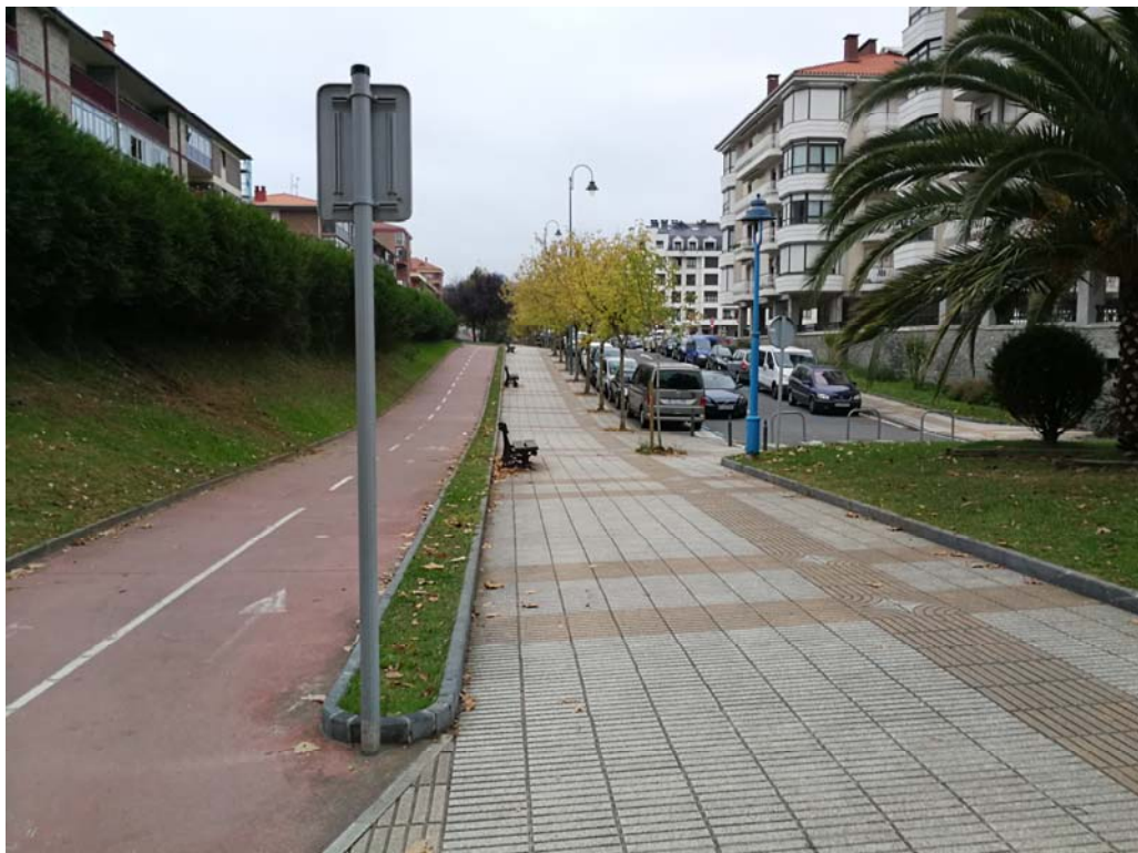
Fotografía 9. Acceso al paso inferior desde la C/ Lapurdi