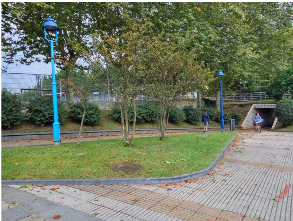
Fotografía 6. Entorno urbano del acceso al paso inferior desde el lado norte