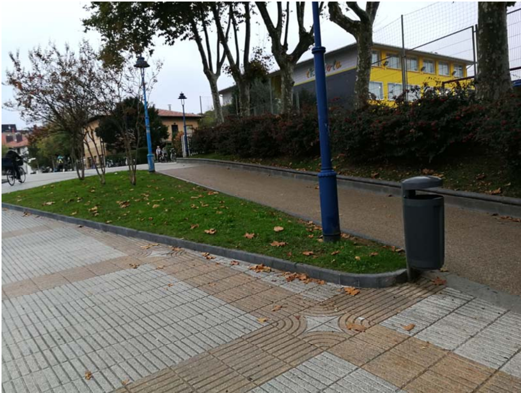
Fotografía 8. Entorno urbano del acceso al paso inferior desde el lado norte