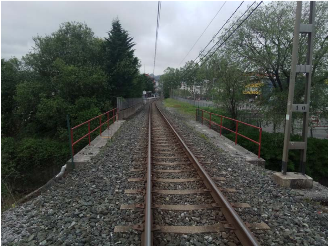
Fotografía 26. Poste de catenaria ubicado al este del ámbito de proyecto junto al arroyo Inurritza