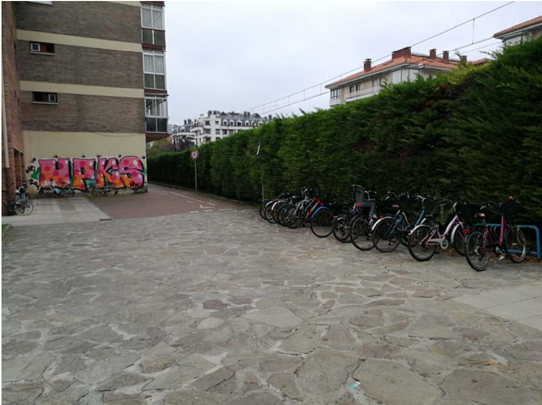
Fotografía 18. Plaza Maria Etxetxiki y bidegorri procedente desde el oeste