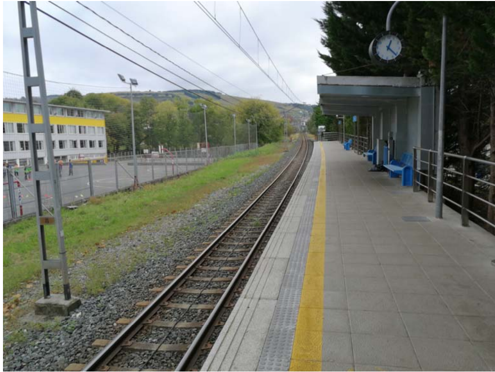
Fotografía 2. Andén actual vista sentido Donostia