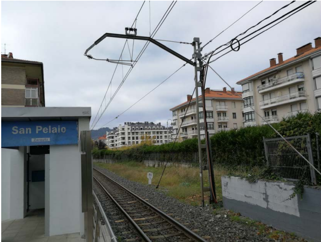
Fotografía 24. Poste de catenaria ubicado junto al acceso actual al apeadero