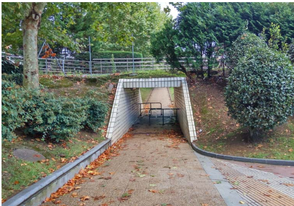
Fotografía 5. Vista del paso inferior desde el norte