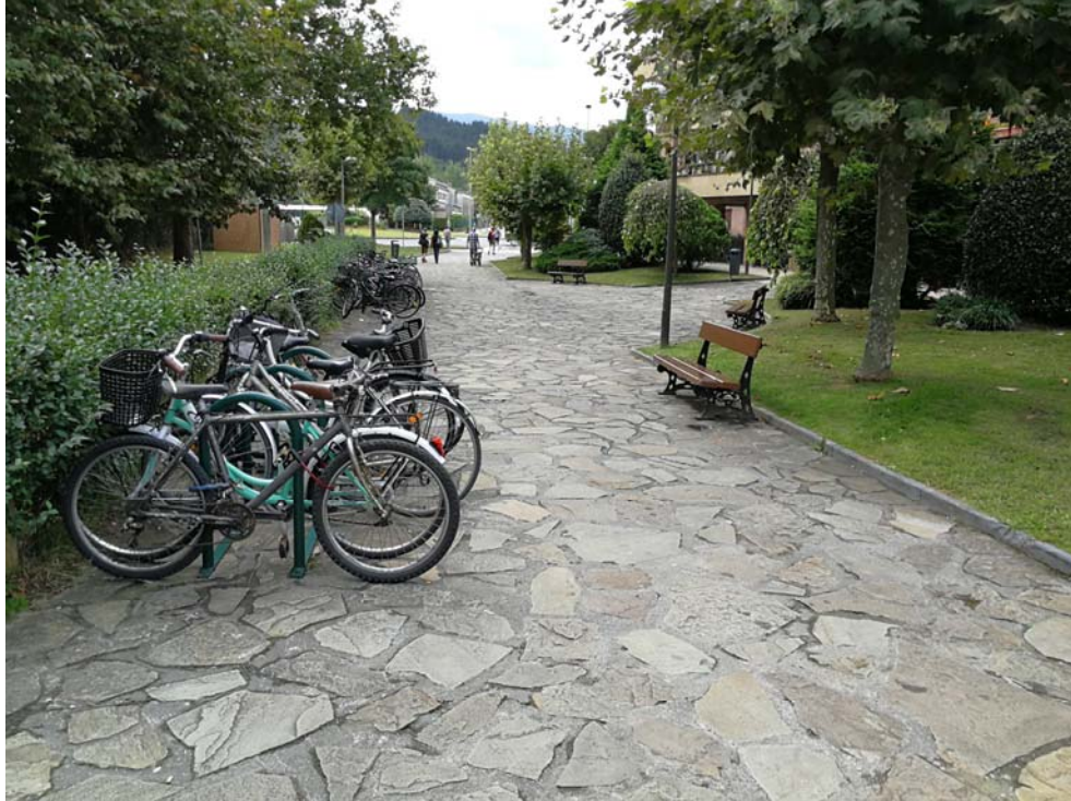
Fotografía 10. Plaza Maria Etxetxiki desde el acceso al apeadero