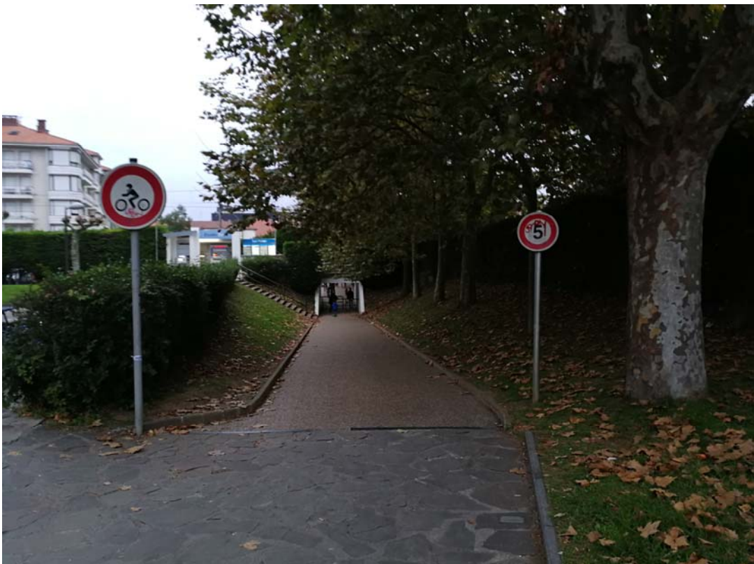
Fotografía 17. Rampa sur de acceso al paso inferior, vista desde el sur