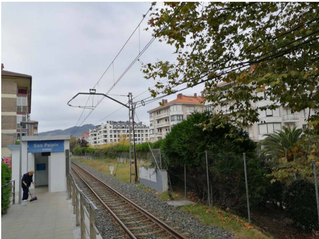
Fotografía 1. Acceso al apeadero desde el andén