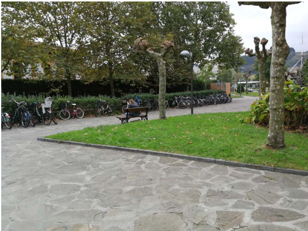
Fotografía 13. Plaza Maria Etxetxiki