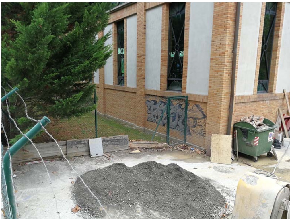
Fotografía 14. Zona de acopio de material de la brigada municipal anexa al andén