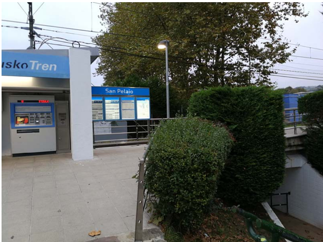
Fotografía 19. Acceso actual al apeadero