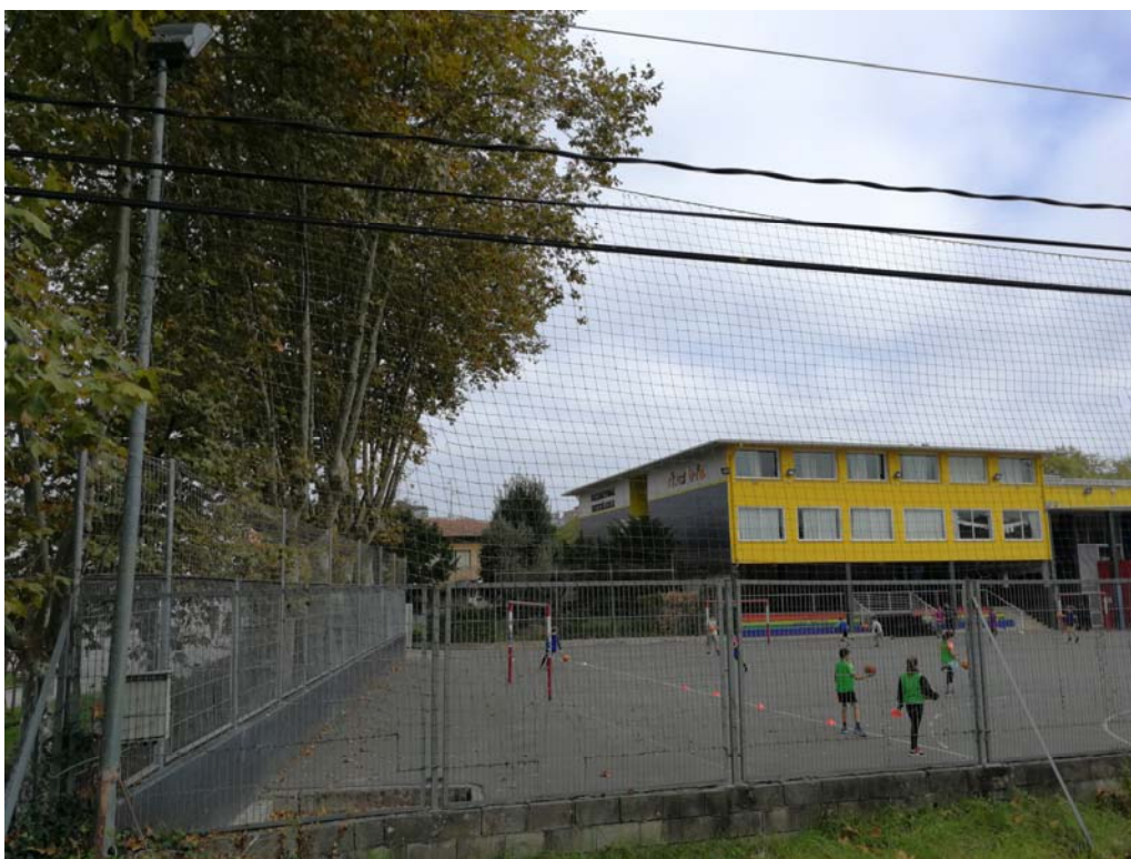
Fotografía 7. Campos de deporte y patio de la ikastola Salbatore Mitxelena