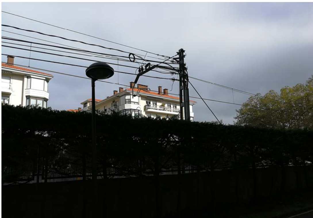
Fotografía 25. Poste de catenaria ubicado al oeste del ámbito de proyecto