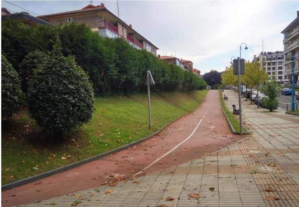
Fotografía 4. Bidegorri que conecta el paso inferior con el oeste del municipio