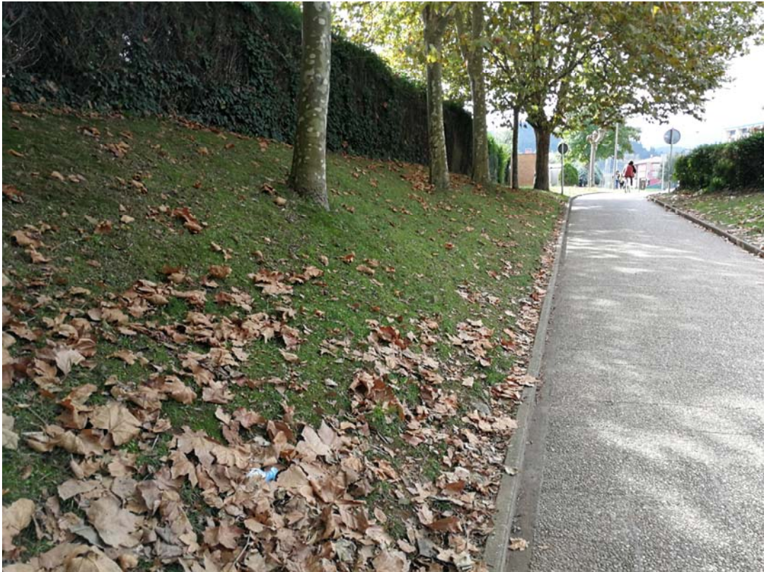
Fotografía 16. Rampa sur de acceso al paso inferior, vista desde el paso inferior