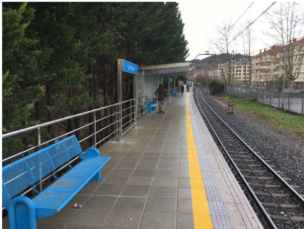
Fotografía 3. Andén actual vista sentido Zumaia