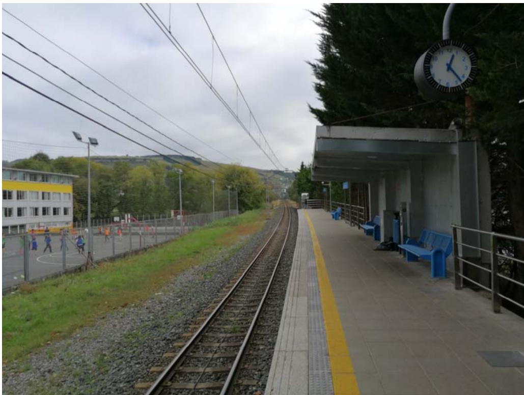
Fotografía 23. Instalaciones existentes en la actualidad en el andén