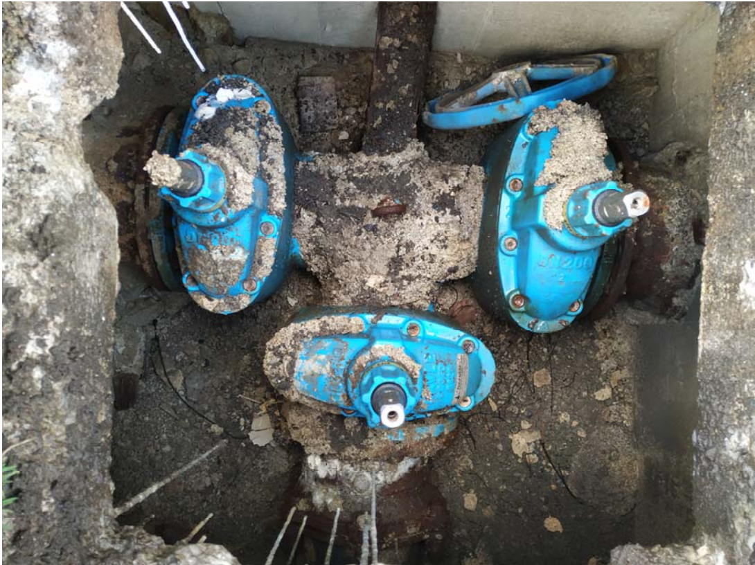
Fotografía 22. Registro y llaves del abastecimiento junto al acceso actual al apeadero