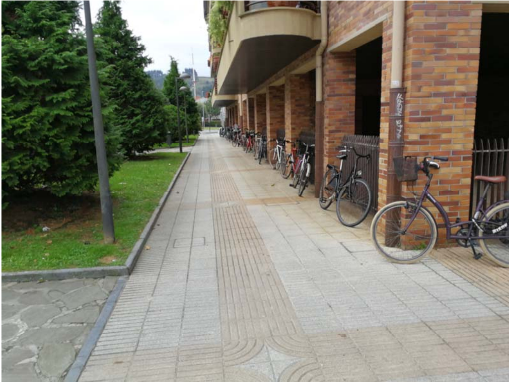
Fotografía 12. Acera entre la plaza Maria Etxetxiki y el edificio anexo