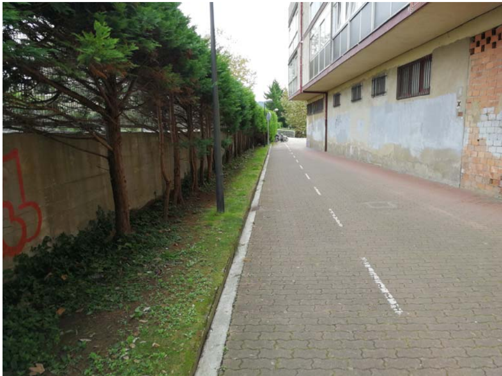
Fotografía 11. Bidegorri de acceso al apeadero, vista desde el oeste