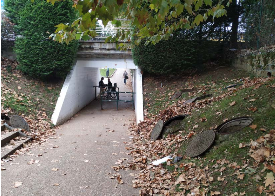
Fotografía 20. Arquetas de Nortegas y Euskaltel al sur del paso inferior