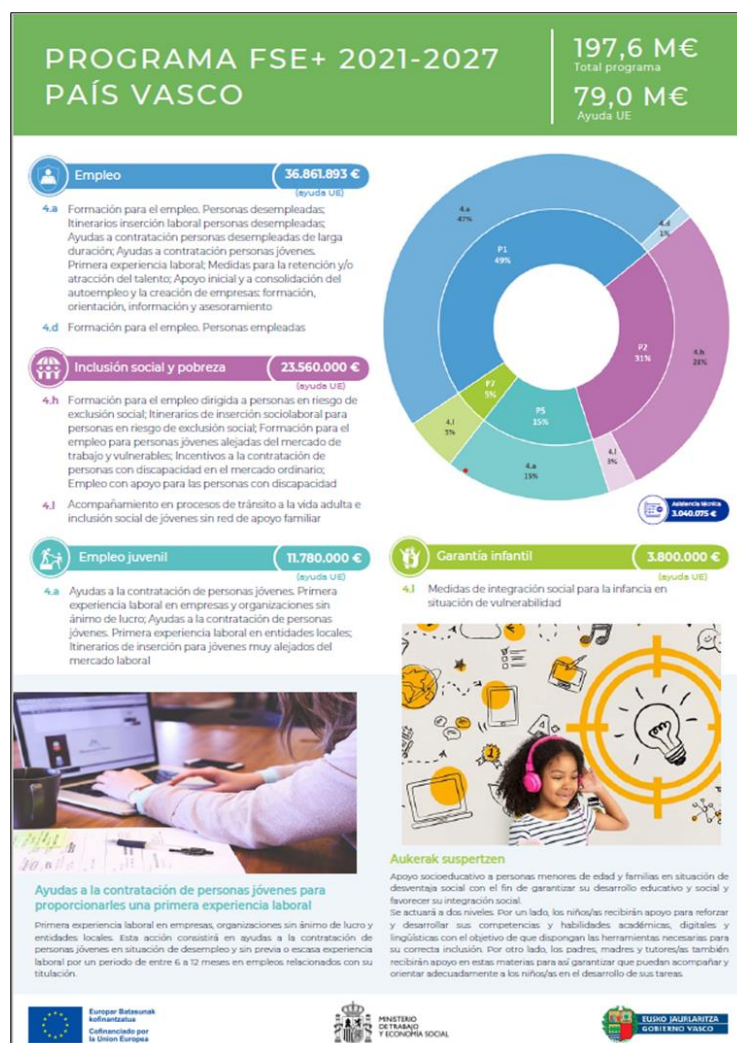
Ilustración 3. Modelo de folleto descriptivo

Los indicadores que contabilizarán esta medida serán el de “Nº publicaciones externas” y “Personas receptoras Medios”.