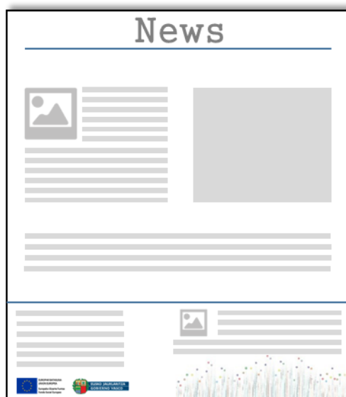
Ilustración 2. Modelo de medio escrito

Los indicadores que contabilizarán esta medida serán el de “Nº publicaciones externas” y “Personas receptoras Medios”.