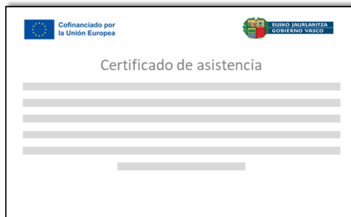
Ilustración 5. Ejemplo del uso del emblema de la Unión y declaración de financiación

Además, cualquier documento relativo a la ejecución de una operación que se destine al público o a participantes, incluidos los certificados de asistencia o de otro tipo, contendrá un reconocimiento del apoyo mediante el emblema de la Unión y la declaración “Financiado por la Unión Europea” o “Cofinanciado por la Unión Europea” que se escribirá sin abreviar y junto al mismo.