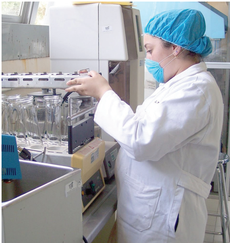
La cofinanciación de las administraciones vascas y el FEDER en el POPV ha permitido apoyar hasta la fecha a cerca de 5.100 proyectos de I+D+i

Esos más de 200 millones de euros invertidos hasta finales del pasado año han supuesto para Euskadi seguir avanzando en muchos de los aspectos que llevan a esta comunidad autónoma a codearse con las regiones europeas más avanzadas en cuanto a la implementación de programas de apoyo público a la investigación e innovación en las empre-