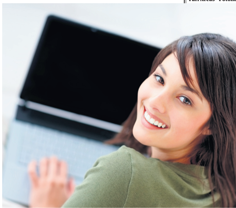
Una iniciativa más al servicio de la calidad de vida de la población.

Se trata de la normalización del expediente electrónico en los procedimientos de la Diputación Foral de Gipuzkoa y de IKUS, un sistema informático integral para la mejora en la gestión de la inspección tri-