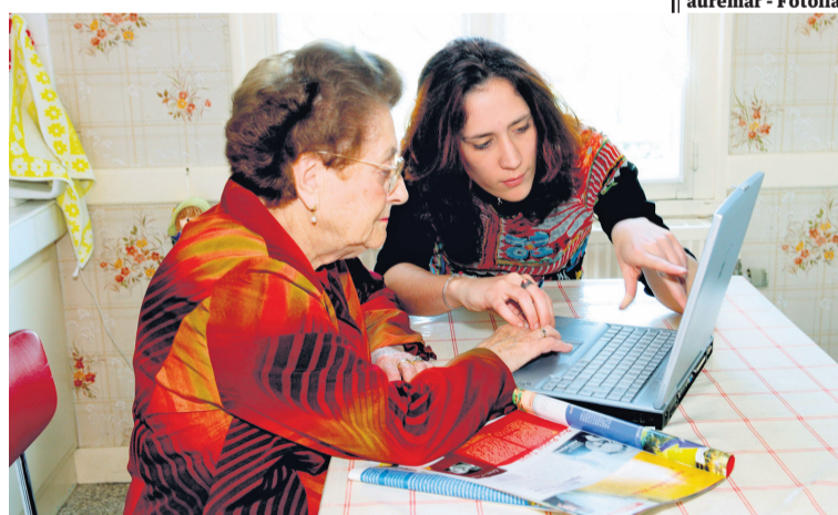
e-udalak es un proyecto de la Diputación Foral dirigido a generar nuevos y mejores contenidos digitales para la ciudadanía.

peitia y Eskoriatza; un sistema de videostreaming (imagen y sonido) para los plenos municipales en Lasarte-Oria; una guía turística para teléfonos móviles en Getaria; aplicaciones para móviles para consultar webs municipales en la Mancomunidad de Tolosaldea; y una plataforma web basada en sistema de información geográfica en varias comarcas, entre otros proyectos. [J.B.N.]