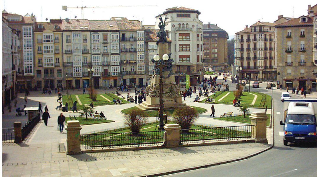
Es crucial atender las necesidades de sostenibilidad urbana si se quiere alcanzar un desarrollo sostenible global y que las ciudades sigan siendo verdaderos motores de crecimiento

Igualmente, la propia Comisión, reconoce que el éxito de las estrategias comunitarias se debe en gran parte en el compromiso y acción de los actores regionales y locales, y fundamentalmente en estos últimos dado que, es a escala local donde mejor se puede explo-