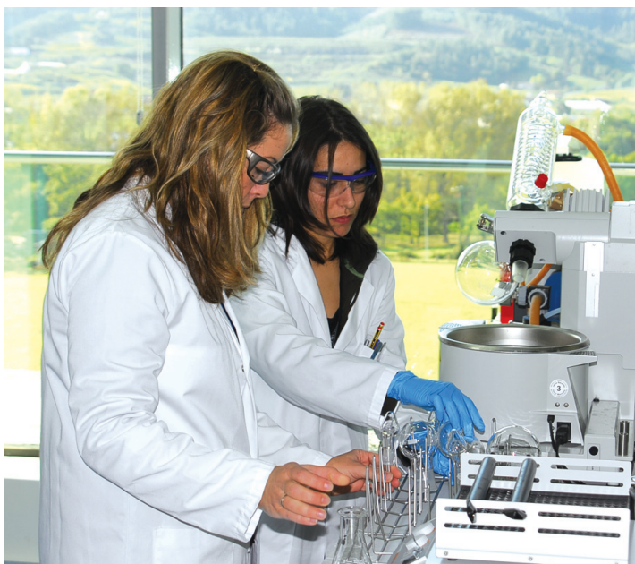
La perspectiva de género está muy presente en el PO FEDER del País Vasco

2007-2013 con actuaciones en los diferentes ejes prioritarios de intervención establecidos en el Marco Estratégico Nacional de Referencia 2007-2013 (MENR) para los Programas Operativos de las regiones del objetivo de competitividad y empleo. La razón está en las numerosas actuaciones y proyectos que tiene la Comunidad Autónoma relativos a la totalidad de los ejes de intervención establecidos en el MENR, así como en el notable recorte de fondos estructurales sufrido por el País Vasco para el nuevo período de programación 2007-2013. No obstante, ha sido necesario realizar un notable esfuerzo de priorización para la inclusión de actuaciones en el Programa Operativo FEDER del País Vasco 2007-2013 en un contexto en el que se ha tratado de elaborar un programa relativamente equilibrado, con intervenciones en todos los ejes, para tratar de incidir en las diferentes necesidades de intervención que presenta Euskadi, pero con el objetivo de cumplir holgadamente con el criterio de que al menos el 75% de las inversiones del País Vasco, como región del objetivo de competitividad y empleo, estén orientadas a la consecución de los objetivos de Lisboa.