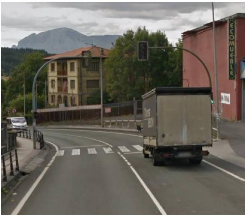
Paso peatonal y semáforos en la zona de la ubicación de la pasarela.

Nos surge la duda sobre la influencia de la nueva pasarela en el semáforo existente: ¿Sería posible desplazar uno de los dos semáforos delante de la pasarela para permitir su visibilidad o incluso desplazar todo el conjunto (el paso de cebra y los dos semáforos) a un lugar con menos influencia de la pasarela?