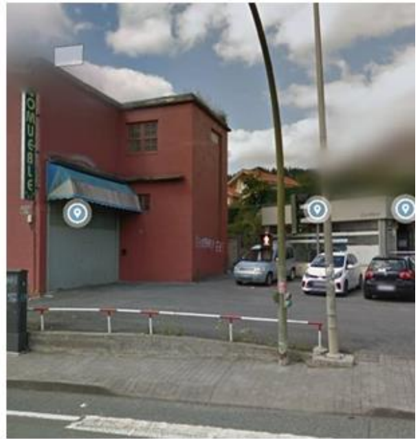
Acceso a edificio existente y a aparcamiento actual, que será sustituido por el nuevo a diseñar.