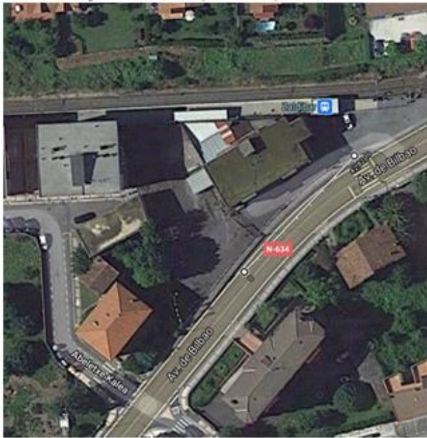
Distancia entre acceso anterior y nuevo aparcamiento.