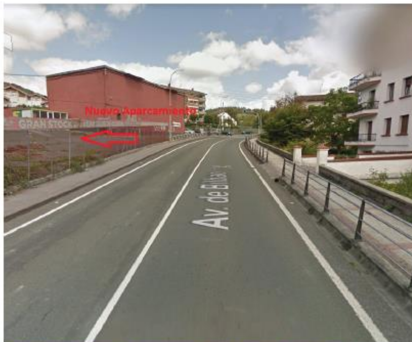
Vista de la parcela destinada al nuevo aparcamiento, desde el carril con sentido Donostia.