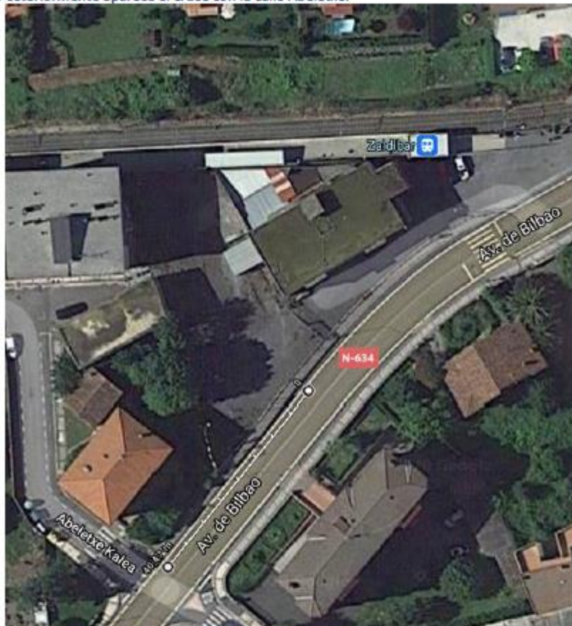
Distancia entre cruce con calle Abeletxe y el nuevo aparcamiento.

Necesitamos saber desde dónde se debe realizar la medida de los 40 m obtenidos (entre ejes de accesos...) y si deben mantenerse tanto antes del nuevo acceso como después. También querriamos saber si el cruce con la calle Abeletxe se considera un acceso más.