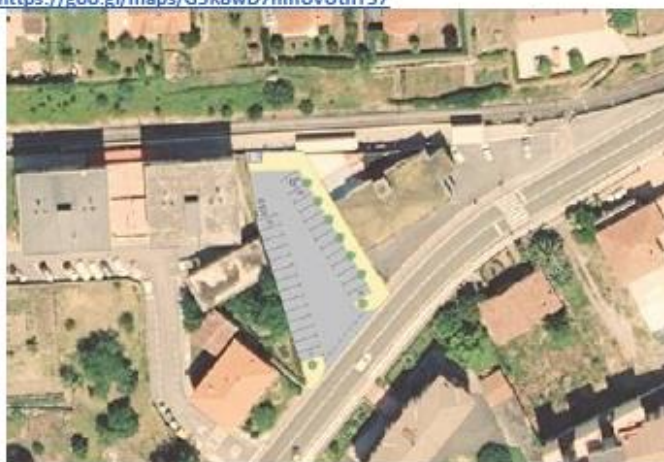
Parcela acondicionada como aparcamiento.

El proyecto que tenemos que redactar, también incluye el acondicionamiento de una parcela contigua a la carretera N-234 para ejecutar un aparcamiento. El acceso se realizaría directamente desde el tramo en travesía de la N-634: https://goo.gl/maps/G5K8wD7hmUvUtnYS7