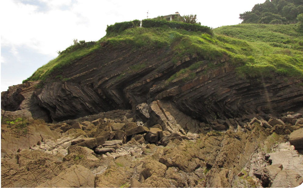
Aitzandi lurmuturreko toles etzana.