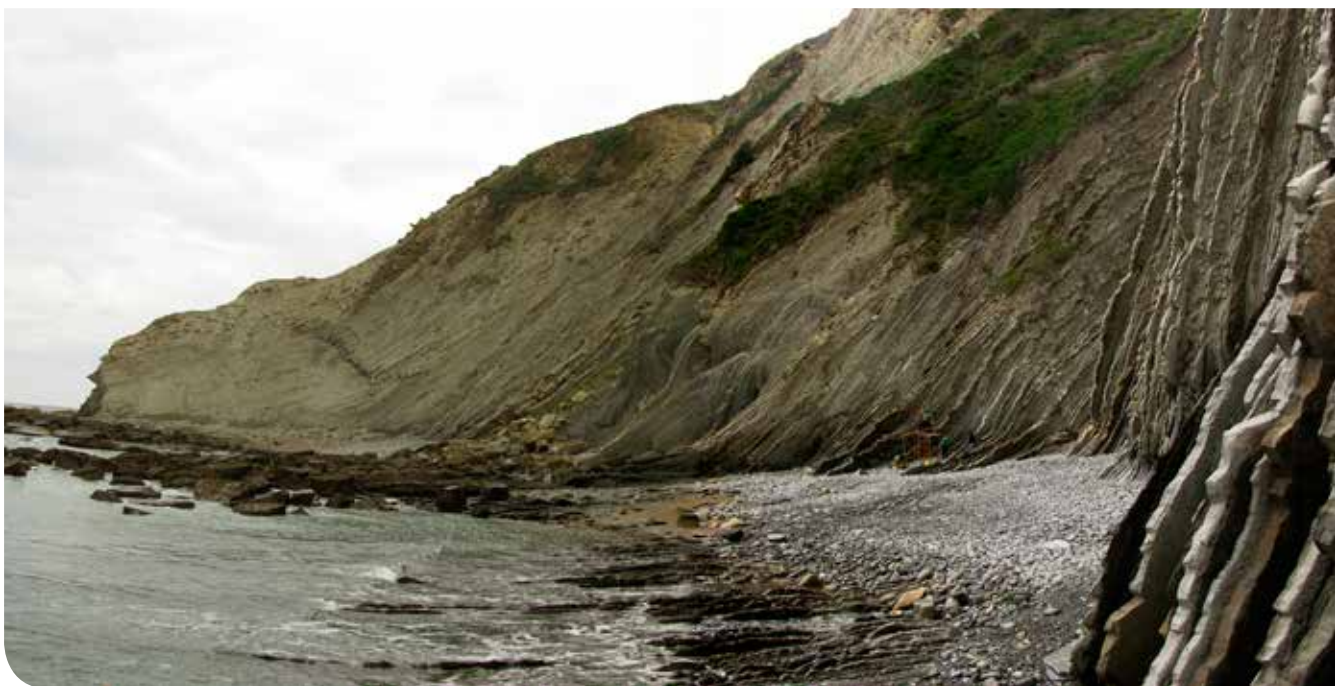
Harkosko-hondartza, labarrak, bloke eroriak eta Itzuruntxiki inguruko luizia.

Hondartzako beste elementu berezietako batzuk Itzurungo haitzuloak dira. Daniarreko hormatarreko hormetan eratuta daude, non itsasoaren eta eragile atmosferikoen higadurak bereziki arroka beraren haustura bertikalen alderantz eragiten baitute. Haitzulo bitxi horietako batzuek 15 metrotik gorako sakonera dute, eta haietakoren batek sifoi gisa funtzionatzen du.