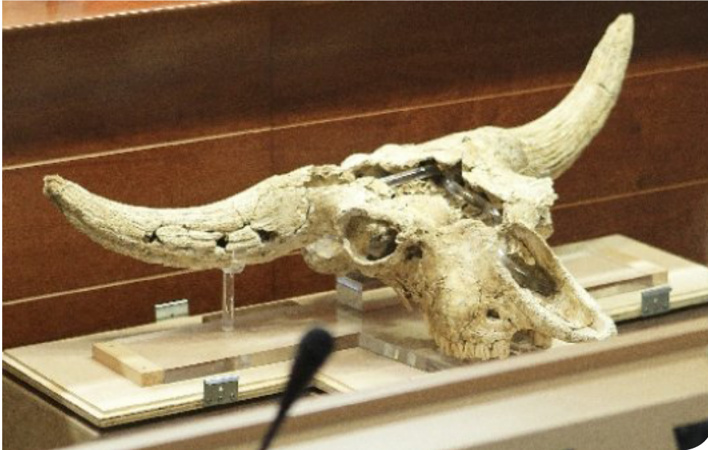
Kiputz-eko bisonte-garezurraren berregitea.