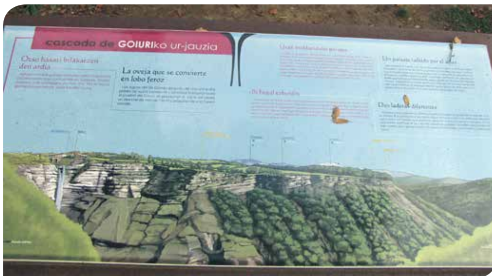
Ur-jauziaren begiratokian dagoen interpretazio-panela.