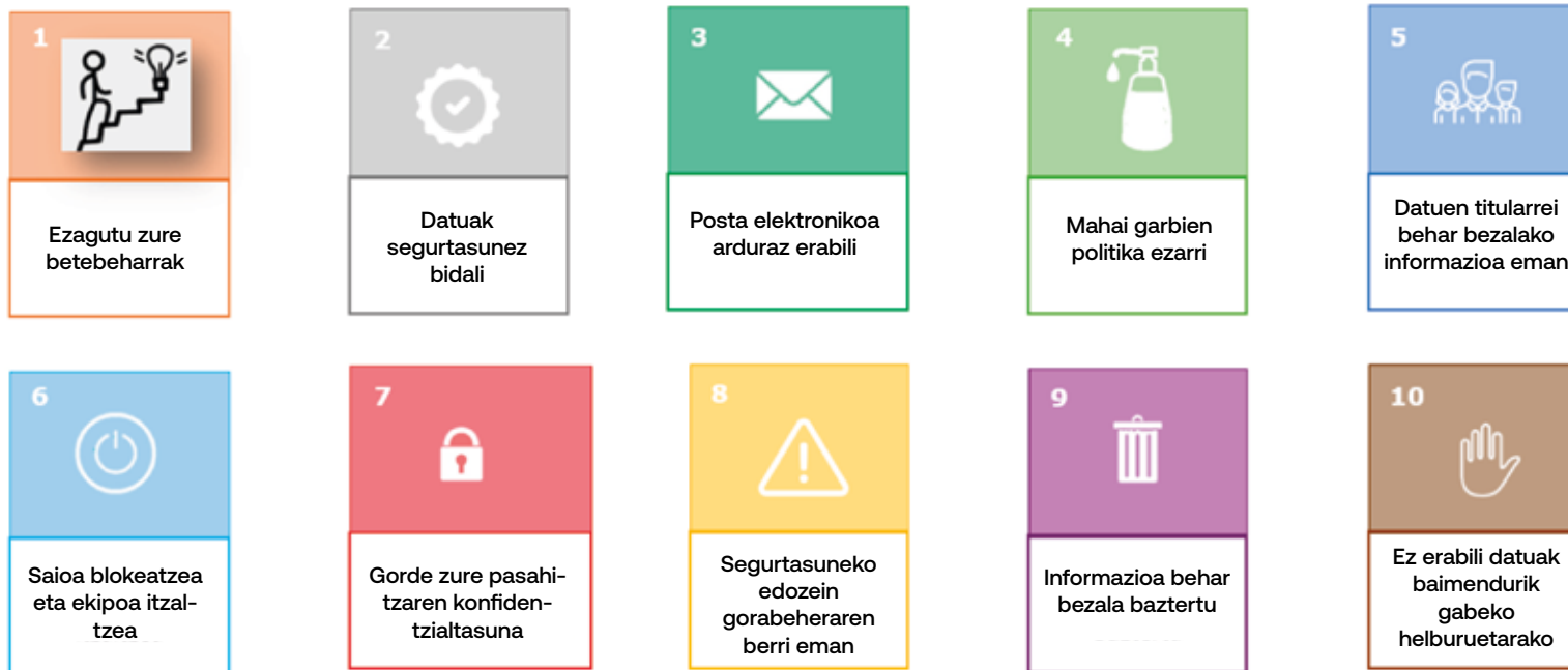
IVAPen dekalogoa, datu pertsonalak babesteari buruzkoa