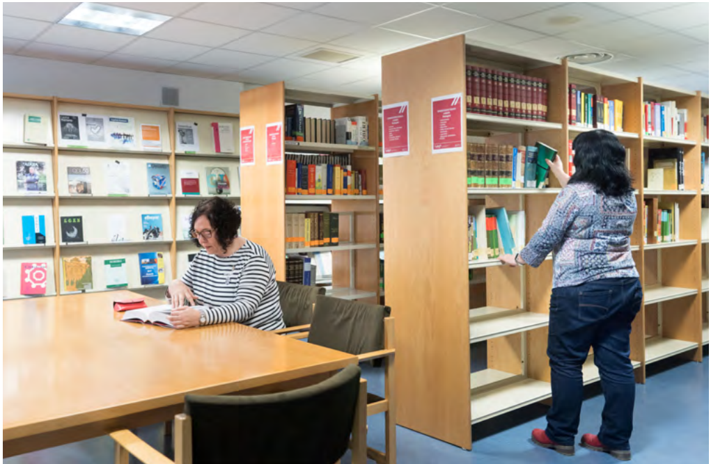
Dokumentazio-guneak eskura ditu monografiak eta aldizkari espezializatuak