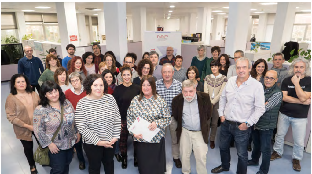
IVAPeko zuzendaritza-taldea eta langile batzuk

IVAPeko kideen% 72k parte hartzen du martxan dauden bederatzi batzordeetan, 25 prozesu-taldeetan edota lan-taldeetan.