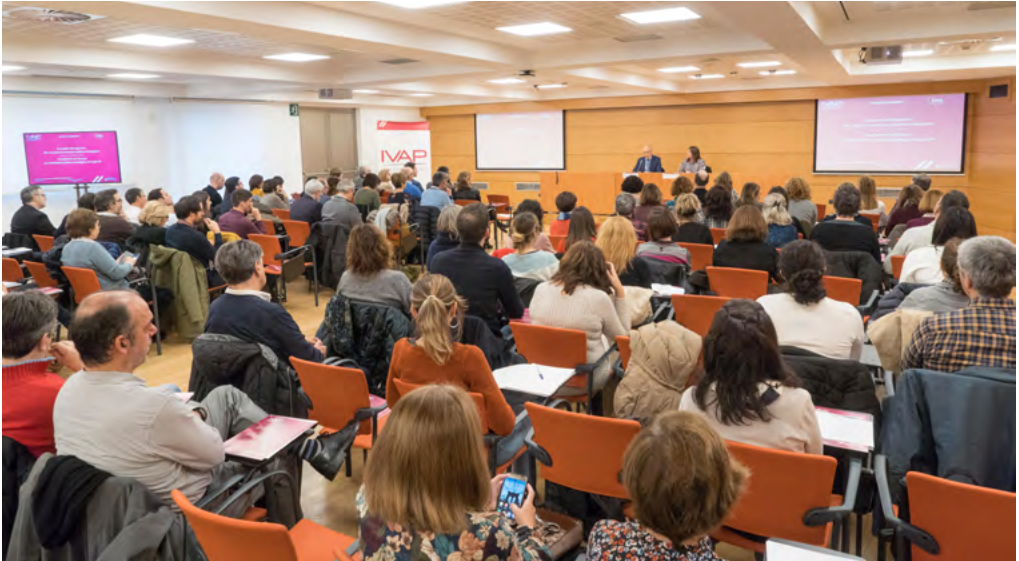
IVAPek antolatutako kontratazio publikoari buruzko prestakuntza-saioa