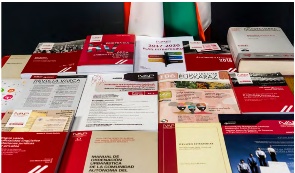
IVAPeko argitalpen batzuk

Oñati (Gipuzkoa): Instituto Vasco de Administración Pública = Herri Ardularitzaren Euskal Erakundea, 2019. ISBN: 978-84-7777-569-0