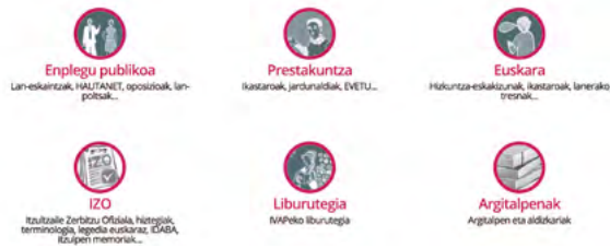
IVAPeko web-orria eta Administrazio-hizkera argia bloga