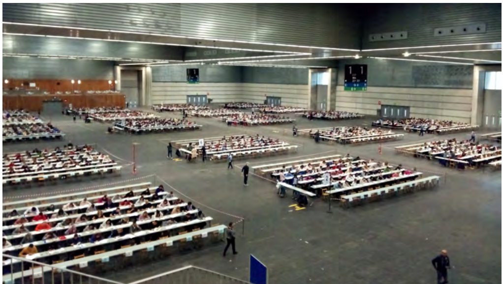
Hizkuntza-eskakizunak egiaztatzeko deialdia