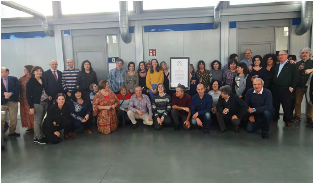
IVAPeko langileak kudeaketa aurreratuaren zilarrezko A aitopena lortu izana ospatzen

2017-2020 aldirako Plan Estrategikoaren erronkak eta helburu estrategikoak berrikusi eta adostu ondoren, aginte-taulako adierazle guztiak aztertu eta egokitu ditugu, aipatu helburu estrategikoen ebaluazioa errazteko.