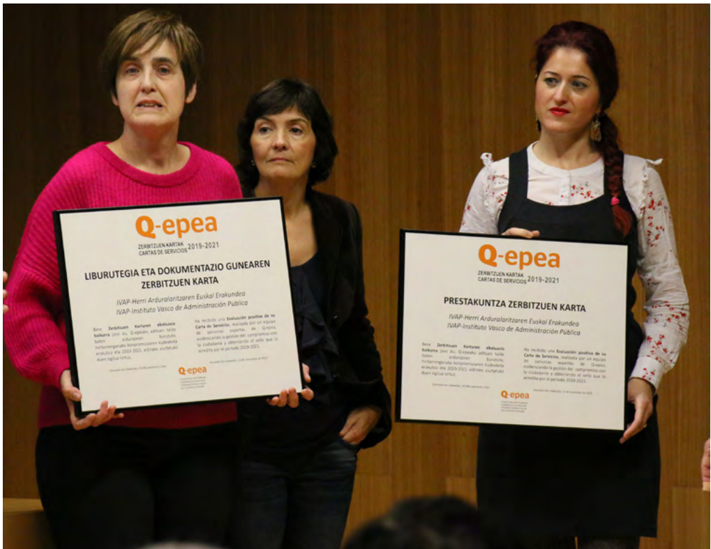
2019an, «Q-epa» egiaztagiria lortu zuten bi zerbitzu-karteetako arduradunek diploma jaso zuten

IVAPek, 2019an, zerbitzu-kartak ebaluatzeko eskaera egin dio Q-epa kudeaketa aurreratuaren konpromisoa duten Euskadiko erakunde publikoek osatutako taldeari, IVAP bertako kidea baita 2006tik. Q-epa berezko metodologia sortu du erakunde laguntzaileen zerbitzu-kartak ebaluatzeko eta, horren bidez, zerbitzu-kartaren bi urtez behineko ebaluazio objektiboa, errepikagarria eta independentea bermatzen du. 2019an, Zerbitzu-karten «Q-epa» egiaztagiri bana eman zien IVAPeko bi kartari: Prestakuntza Zerbitzuari eta Liburutegia eta Dokumentazio-gunearen Zerbitzuari.