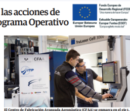
El Centro de Fabricación Avanzada Aeroespacial (CFAA) se enmarca en el eje 1.

El informe de la ejecución de los programas en la reunión del Comité se puede consultar a partir de finales de 2020. La ayuda asignada en el período anterior a 2014-2020 ascendió a 140 millones de euros, lo que supone un 19% por encima de los 117 millones de euros que se asignaron en el período anterior.