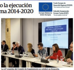
La 22ª reunión del Comité de Seguimiento se celebró en Donostia.

El informe de la ejecución de los programas en la reunión del Comité se puede consultar a partir de finales de 2020. La ayuda asignada en el período anterior a 2014-2020 ascendió a 140 millones de euros, lo que supone un 19% por encima de los 117 millones de euros que se asignaron en el período anterior.