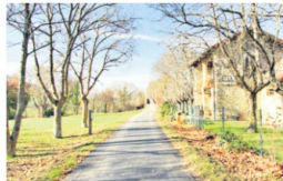
Vista del Viejo Ferrocarril Vasco-Navarro entre Ormaiztegui y Vitoria-Gasteiz.

La Diputación Foral de Álava ha participado en el Programa Operativo FEDER del País Vasco 2014-2020 con una asignación de ayuda de 8,7 millones de euros, a través de los ejes relacionados con la I+D+i, la competitividad de las pymes, el paso a una economía baja en carbono, la prevención y gestión de riesgos y la conservación del medio ambiente.