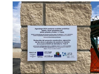
Colector de Agurain