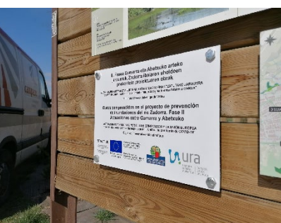
Prevención de Inundaciones río Zadorra