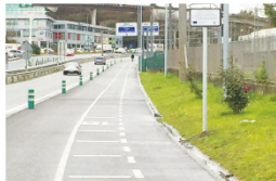
El desarrollo del Plan Territorial de Vías Ciclistas se ha incluido en el POPV FEDER.

A 17,4 millones de euros asciende la ayuda total de la Unión Europea a la Diputación Foral de Gipuzkoa para desarrollar sus actuaciones en el marco del Programa Operativo FEDER del País Vasco 2014-2020. Los mejores en el uso y calidad de las TIC, y el impulso hacia una economía baja en carbono han sido los ámbitos en los que ha contribuido principalmente la UE.