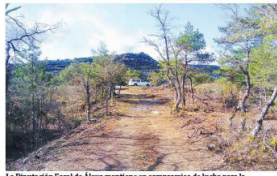
La Diputación Foral de Álava mantiene un compromiso de lucha por la prevención y mitigación de los riesgos relacionados con el clima.

Con la actuación para prevenir los incendios se han protegido casi 35.900 hectáreas de suelo en todo el periodo