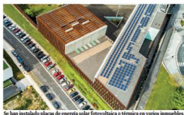
Se han instalado placas de energía solar fotovoltaica e térmica en varios inmuebles.

La institución foral realiza en los edificios de su propiedad mejoras para impulsar la eficiencia energética