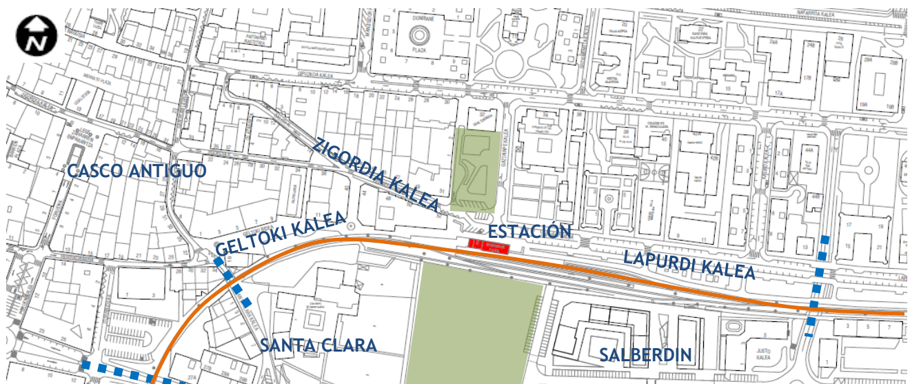
Diagrama del estado actual

Lo que en su día era el final de la ciudad, ahora se ha convertido en la barrera a superar.