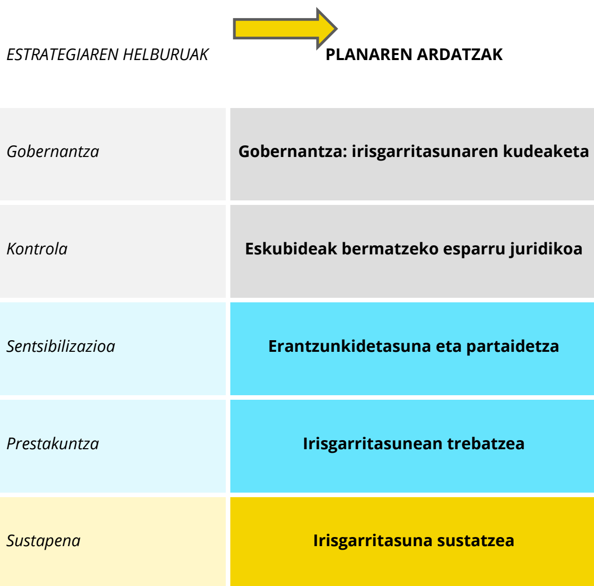
Grafikoa 5. Estrategiaren helburuak eta Ekintza Planaren ardatzak.

Funtsean, Plan hau Estrategiaren Helburuei erantzuten dieten ardatzekin egituratzen da, helburuekin bat eginez, baina terminologia neurri batean egokituz eta planteatutako hiru logikekin koherentea den arkitektura eskainiz, horiek ere Estrategiaren logikak baitira. Gainera, laugarren logika bat dago, operatiboa, eta horren ondorioz, Ekintza Planeko Ardatzak antolatu eta taldekatu egiten dira, helburu orokorra lortzera modu argian bideratzeko. Sei ardatz horiek hauen inguruan antolatzen dira: zer egitura behar den, zer aldaketa behar diren eta zer egin behar den irisgarritasuna sustatzeko.