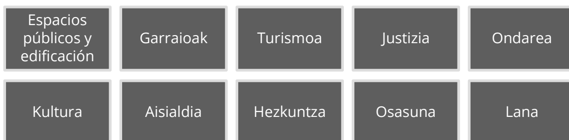
Grafikoa 3. Estrategiaren jarduera-eremuak