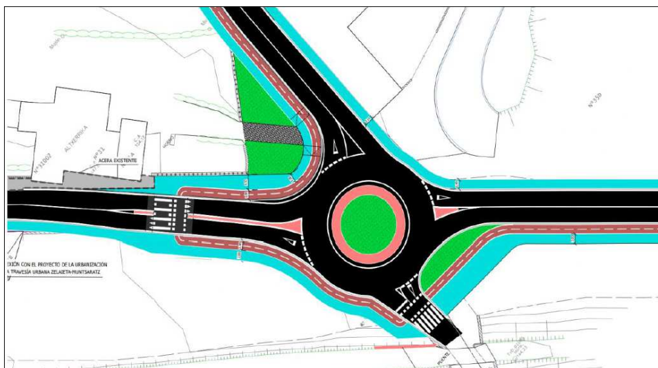
Solución 3B. Solución al tráfico rodado, peatonal y ciclable incorporada e incluida en el Texto Refundido.