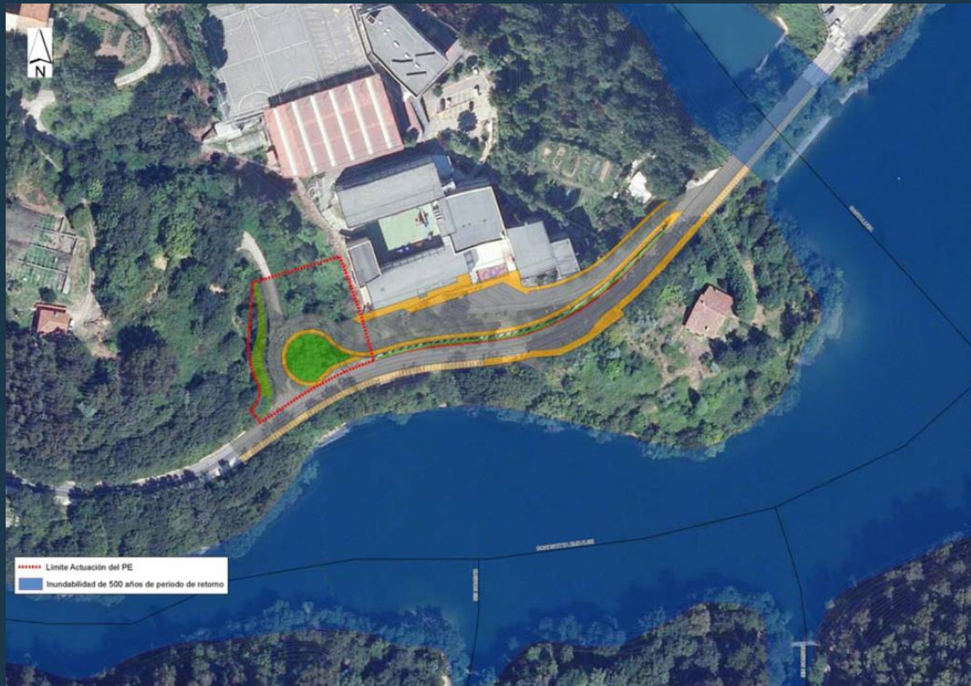
Mapa de Inundabilidad para un periodo de retorno de 500 años en el ámbito de actuación