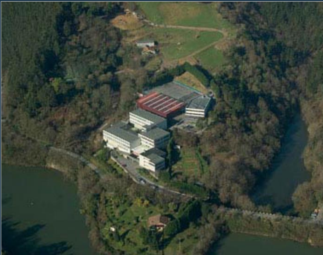
COLEGIO EL REGATO