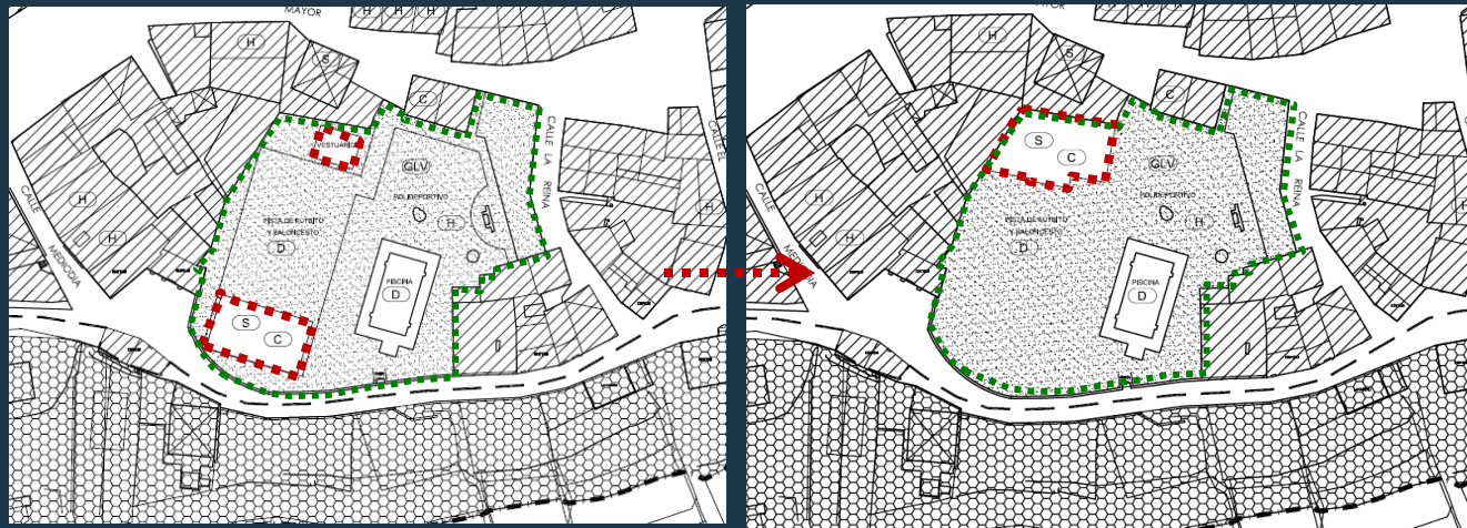
Indarrean dagoen planeamendua Planeamiento vigente