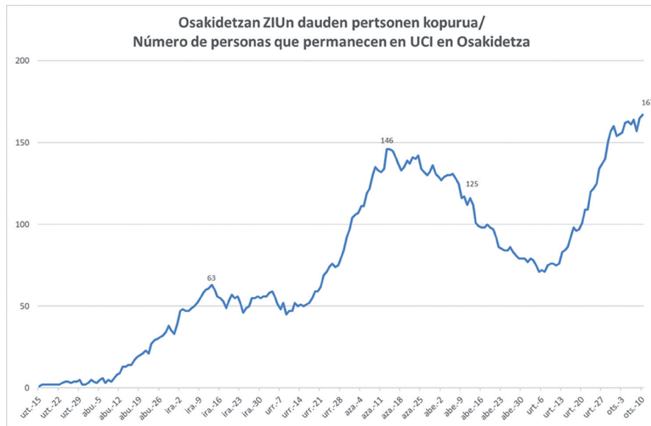
Gráfica 2.

A primeros de abril, se alcanza la cifra más alta de personas fallecidas, 51 en una solo semana. En esta primera gráfica podemos comprobar que, en el segundo pico epidémico de la segunda ola, a mediados de noviembre, es de 26. Desde entonces, en el tercer pico epidémico, todavía no se ha alcanzado esta cifra. Desde principio de marzo de 2020 y final de enero de 2021, el número total de personas fallecidas en Euskadi por COVID-19 es de 3.291. Este dato es el reflejo más duro de la realidad del impacto de la COVID-19.