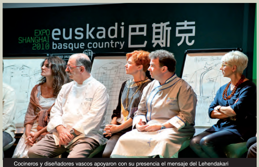
Cocineros y diseñadores vascos apoyaron con su presencia el mensaje del Lehendakari