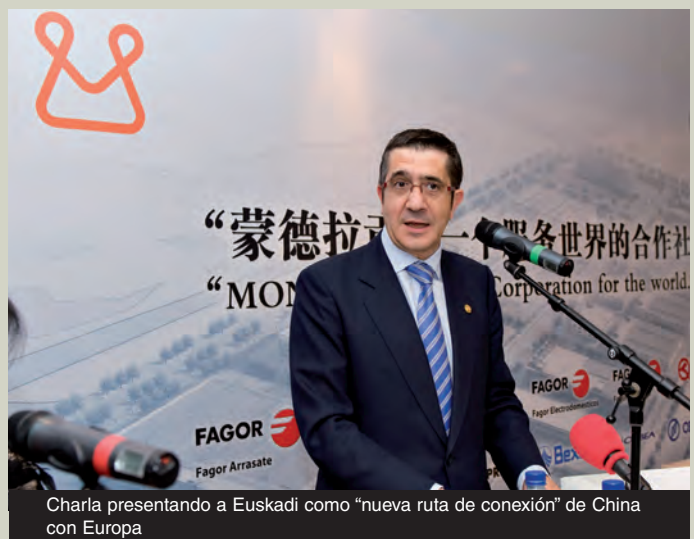
Charla presentando a Euskadi como "nueva ruta de conexión" de China con Europa