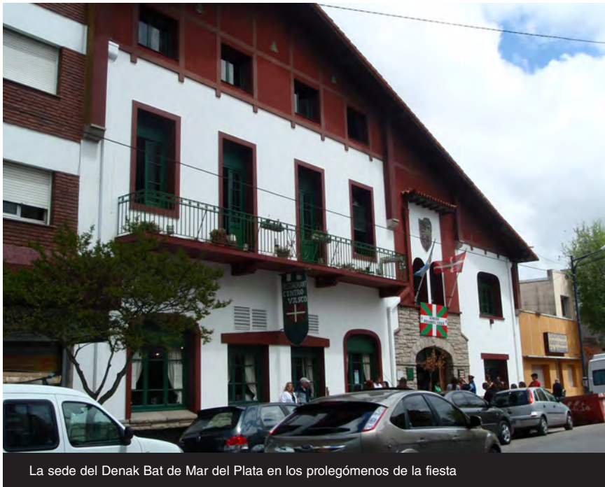
La sede del Denak Bat de Mar del Plata en los prolegómenos de la fiesta