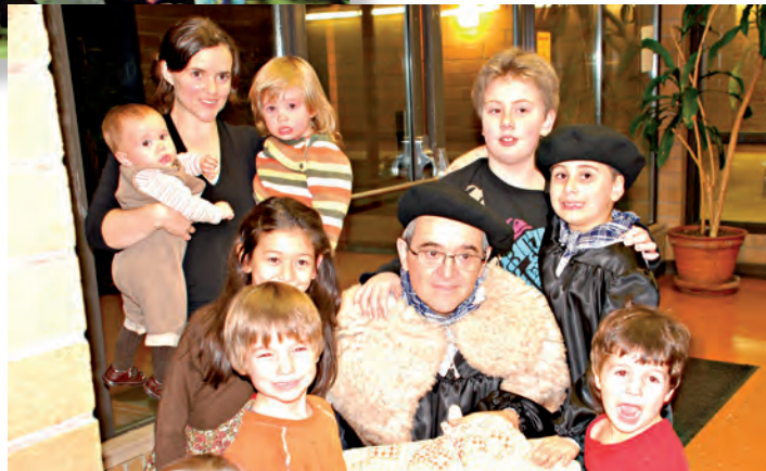
Olentzero de Vancouver, versión canadiense del personaje vasco

con todas sus fuerzas en el Basque Center la canción 'Olentzero begigorri'. El alcalde de la ciudad, el euskaldun Dave Bieter, ejerció de maestro de ceremonias, relatando él mismo a los txikis la leyenda de Olentzero.