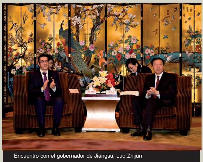
Encuentro con el gobernador de Jiangsu, Luo Zhijun