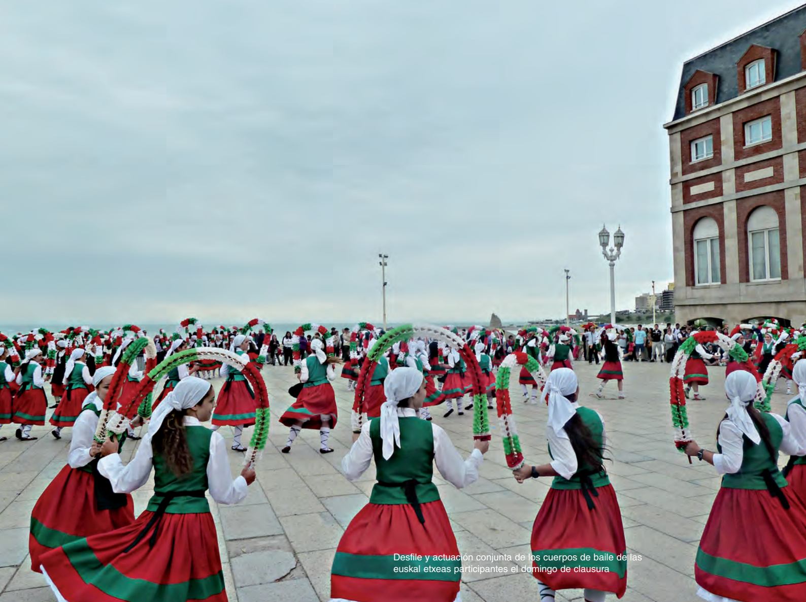
Desfile y actuación conjunta de los cuerpos de baile de las euskal txexas participantes el domingo de clausura