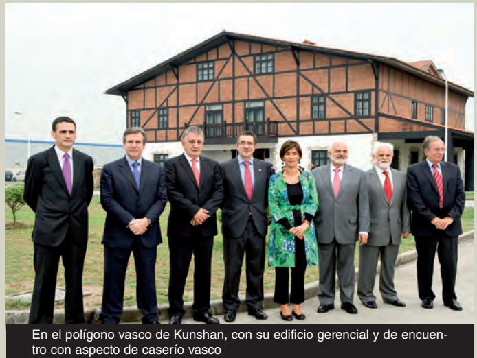
En el polígono vasco de Kunshan, con su edificio gerencial y de encuentro con aspecto de caserío vasco