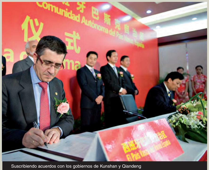
Suscribiendo acuerdos con los gobiernos de Kunshan y Qiandeng