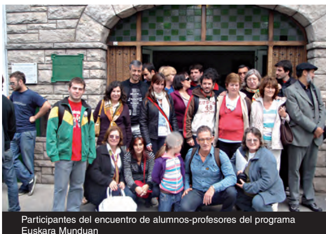
Participantes del encuentro de alumnos-profesores del programa Euskara Munduan