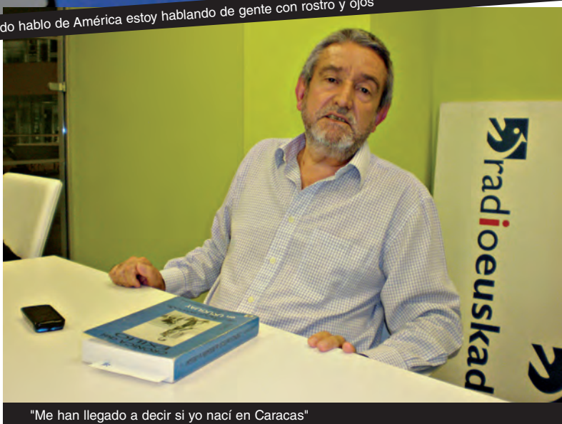
"Me han llegado a decir si yo nací en Caracas"

refugiados de la llamada guerra civil española y la emigración política fueron muy importantes en la organización de la colectividad vasca. Aprovecho para hacer propaganda del hecho de que Euskomedia y Eusko Ikaskuntza han llevado a cabo una encomiable labor de digitalización y han colocado en la red, fácilmente accesibles, numerosos materiales y documentos históricos, entre ellos la correspondencia que mantenía por ejemplo Manuel de Irujo con todo el mundo, también con el Centro Vasco de Caracas. Ahí queda en evidencia la pujanza y la relevancia, hasta qué punto jugó un papel clave y hasta qué punto las instituciones vascas del exilio dependieron durante muchos años del dinero que les llegaba concretamente desde la colectividad vasca y el Centro Vasco de Caracas".