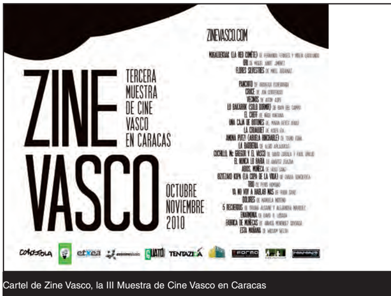
Cartel de Zine Vasco, la III Muestra de Cine Vasco en Caracas