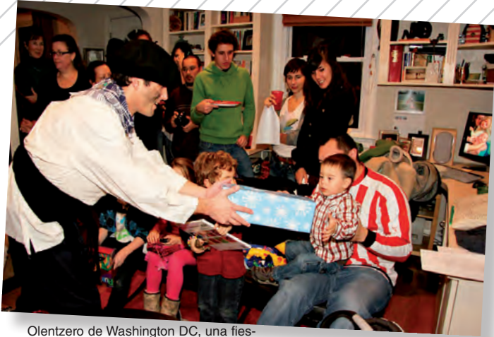
Olentzero de Washington DC, una fiesta que la joven etxea local organiza desde su formación