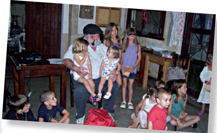
Olentzero de Chascomús, Argentina. Hubo colas para sentarse a su regazo. A su recibimiento se invitó a todos los niños chascomunenses