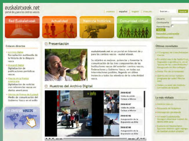
Aspecto de la portada de la página EuskalEtxeak.net

www.euskaramundiala.net www.etxepareinstitutua.net www.kultura.ejgv.euskadi.net/r46-etxepare/es