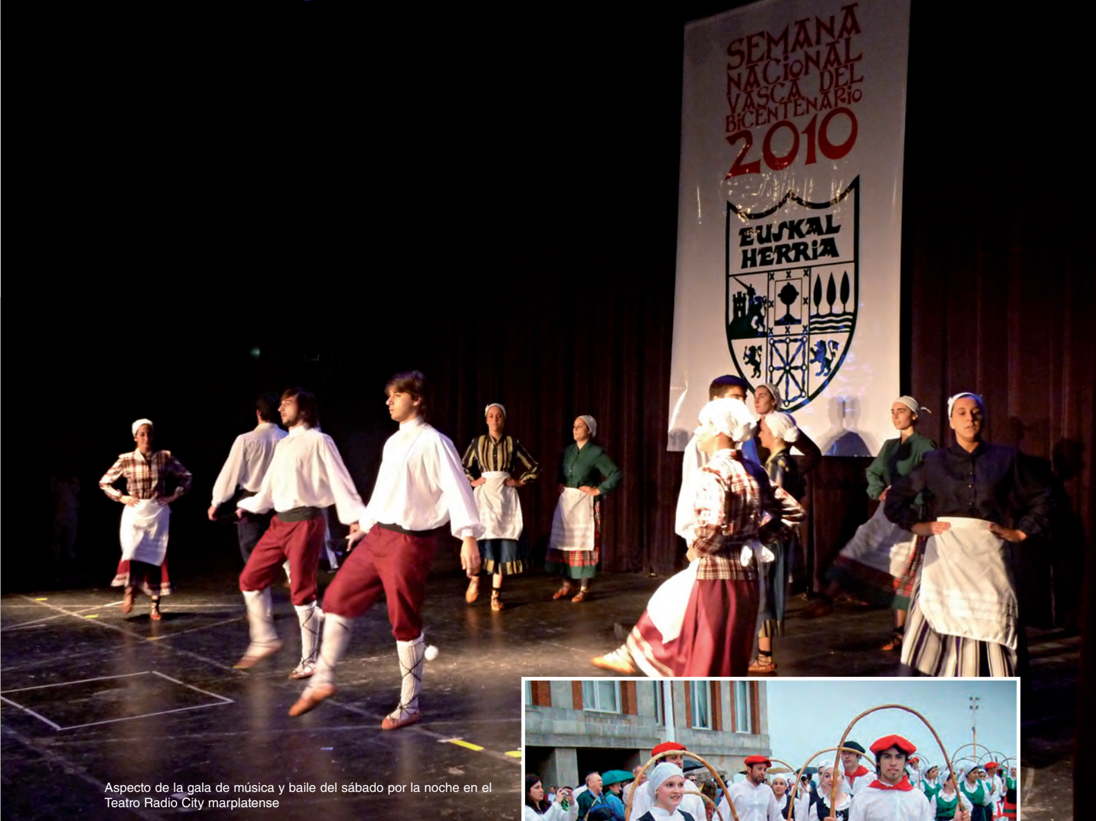
Aspecto de la gala de música y baile del sábado por la noche en el Teatro Radio City marplatense