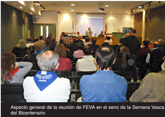
Aspecto general de la reunión de FEVA en el seno de la Semana Vasca del Bicentenario