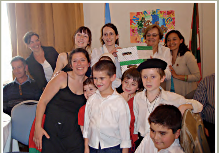
Los txikis de Mar del Plata tras recibir su premio en el marco del banquete de clausura