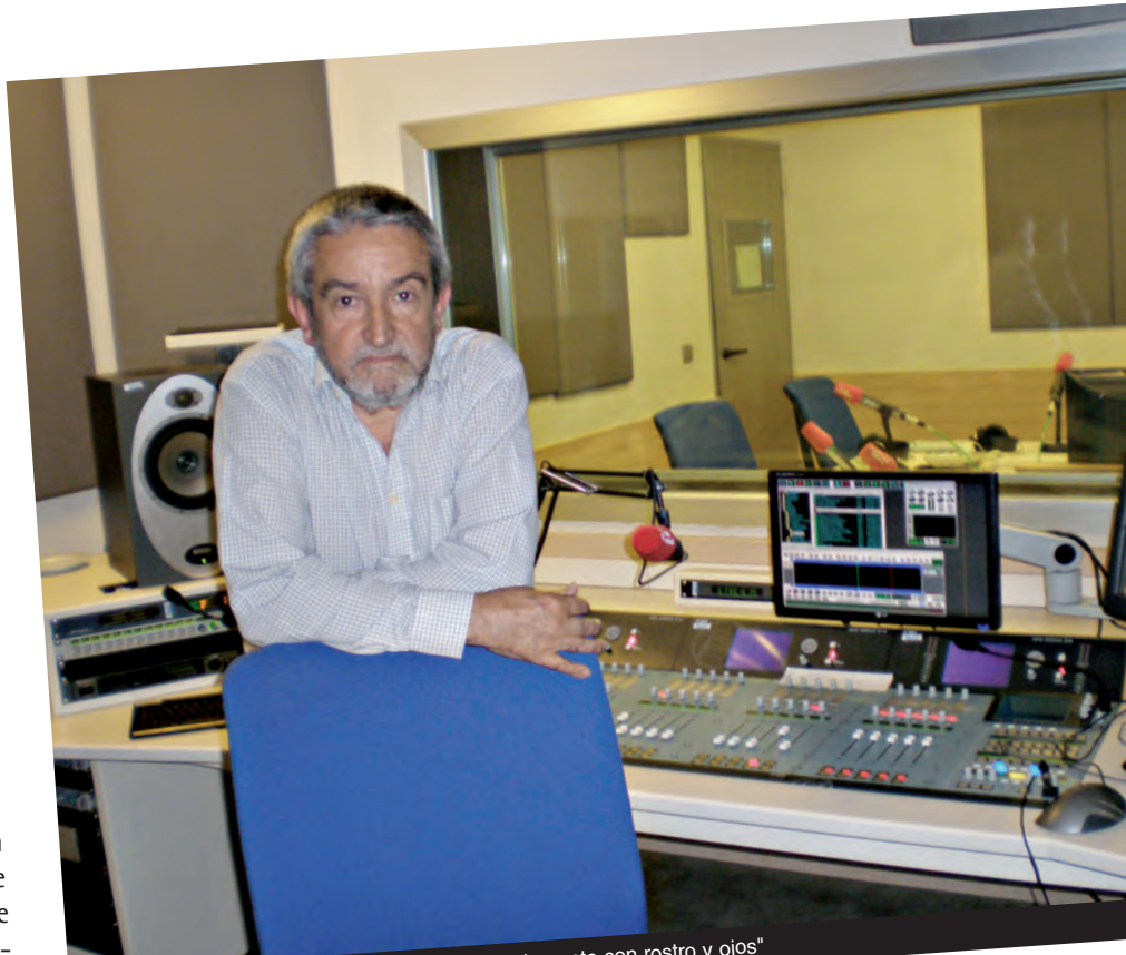
"Cuando hablo de América estoy hablando de gente con rostro y ojos"

"Me han llegado a decir si yo nací en Caracas. Fui a Caracas con 25 años y con 35 regresé a Euskadi. Lo que ocurre es que para mí esos años fueron fundamentales. Era además una época en la que a Venezuela llegaban por motivos políticos gentes de muchos lugares, de Chile, de Argentina, Uruguay... Caracas era un lugar muy interesante. En el caso vasco, los