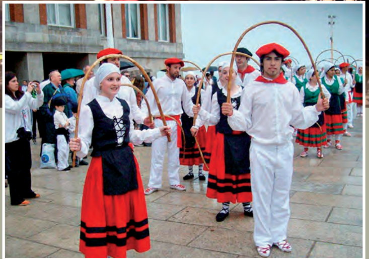
Detalle del espectáculo de danzas del domingo, en el Boulevard Marítimo Patricio Peralta Ramos