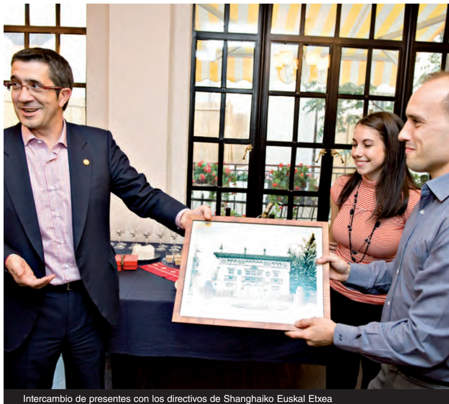
Intercambio de presentes con los directivos de Shanghaiko Euskal Etxea