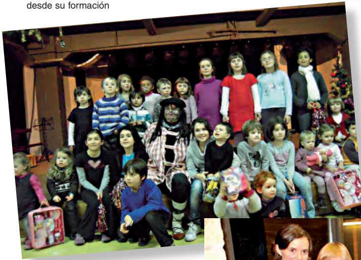
Olentzero de París posando con un grupo de los más chicos de Eskual Etxea de la capital gala