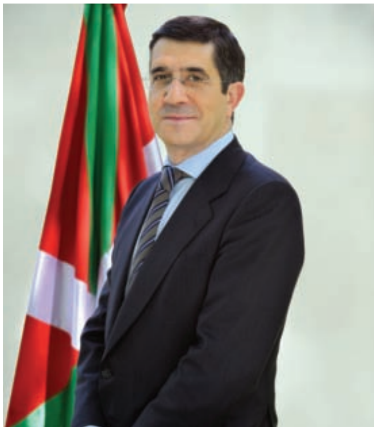
Patxi López, Lehendakari

O hore bat da niretzat Eusko Jaurlaritzara iritsi nintzenetik argitaratutako Euskal Etxeak aldizkariaren lehenengo ale honetan zenbait lerro idatzi eta agur bero bat helaraztea gure mugetatik kanpo bizi diren euskaldun guztiei. Garaia hurbil dugula eta, aukera baliatu nahi dut Gabon zoriontsuak izan ditzazuela eta 2010 urteak zuen nahi guztiak bete ditzala opatzeko.