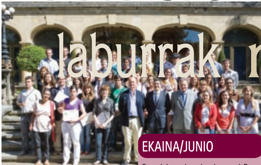
Recepción del Lehendakari a los participantes de Gaztemendu 2009