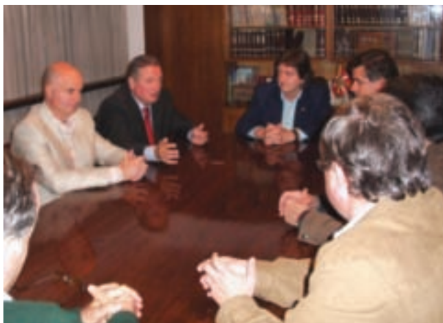
Con la directiva de Eusko Etxea - Casa Vasca de Chile

En el Centro Vasco se abordó el proyecto para un nuevo edificio al servicio de la colectividad vasca. En el Basque Museum se hizo un seguimiento de la exposición que se organizará en Ellis Island. Se tuvo un primer contacto con el Comité del Jaialdi 2010 y se visitó el Centro de Estudios Vascos de la Universidad de Boise, la Fundación Cenarrusa, la Ikastola de Boise. La delegación también pudo asistir a la festividad de San Ignacio, la fiesta más importante de Boise.