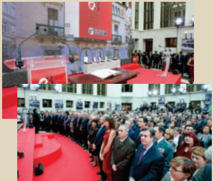
Los asistentes al acto

Tras ellos, tomó la palabra el Lehendakari Patxi López quien definió el Estatuto como "un pacto entre vascos diferentes que deciden vivir juntos, respetando