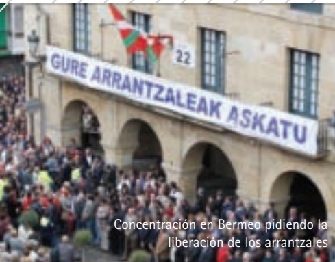
Concentración en Bermeo pidiendo la liberación de los arrantzales