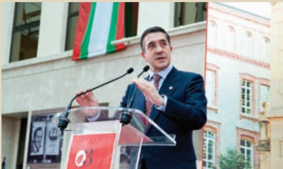
El Lehendakari dirigiéndose a los presentes