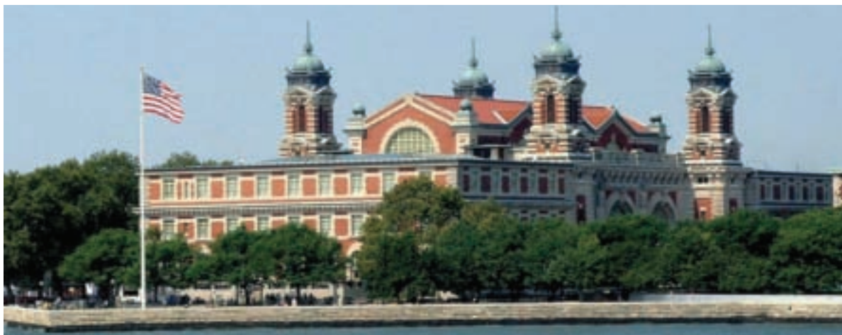
Museo de Ellis Island y lugar de la exposición