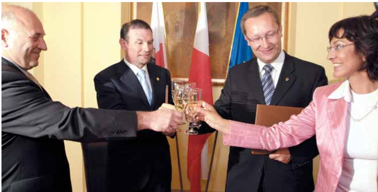
El Lehendakari y la Consejera de Industria con las autoridades de la Baja Silesia.