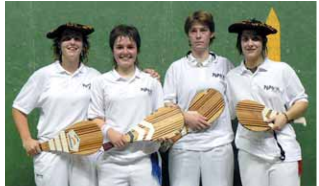
Finalistas del Campeonato de Gipuzkoa de trinquete 2006.

El éxito en este apartado ha sido tal que se ha jugado el campeonato escolar de Gipuzkoa en la modalidad de paleta. Han participado 19 equipos (algunos formados por parejas y otros por 3-4 chicas) de entre 10 y 12 años; otros nueve equipos de entre 12 y 14 años y 8 en la categoría de cadetes. La cantera está asegurada.