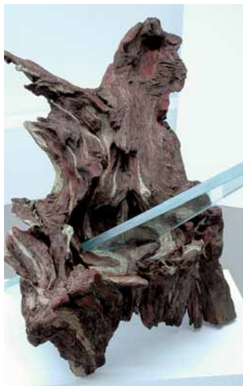
Interpretación escultórica de "Ilunkor", de Ramón Lazkano.

Sí, estoy trabajando sobre la obra de Oliver Messiaen cuyos cien años se cumplen en 2008 y quiero hacer una exposición sobre música y escultura. Una de las obras que realicé en homenaje a los organistas de la iglesia de San Vicente, de Donostia, está ya expuesta.