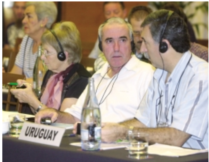
Diecinueve países estuvieron representados en la reunión celebrada en Vitoria-Gasteiz.

• Acercamiento a la cultura vasca también tradicional pero fundamentalmente contemporánea.