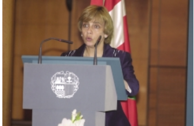
La Consejera de Cultura, Miren Azkarate, durante un momento de su intervención en el Congreso.

Por parte del Departamento de Cultura, la Consejera Miren Azkarate presentó las líneas estratégicas contenidas en el Plan Vasco de la Cultura. Así, comentó que se está estudiando el diseño de la futura Biblioteca Nacional y Archivo Nacional, en los que se integran propuestas como el archivo de la diáspora, la digitalización