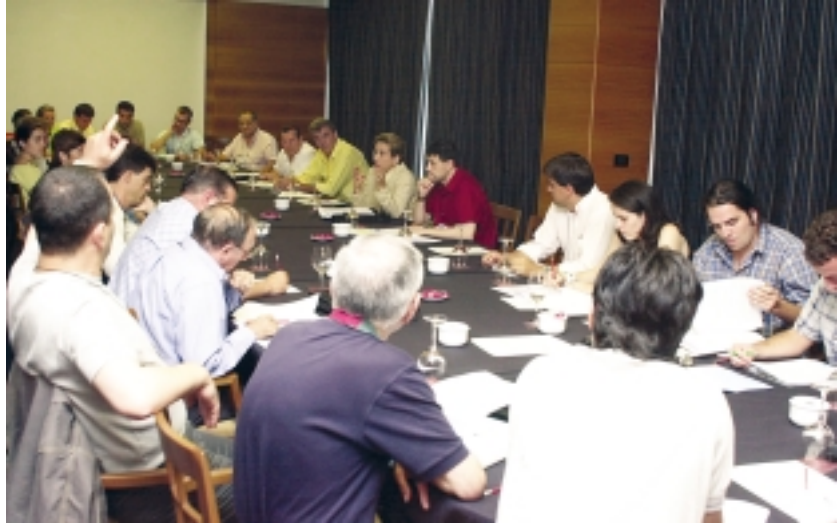
Las comisiones de trabajo se reunieron todos los días para debatir y redactar sus propuestas para el Plan Cuatrienal.

Para ello, hemos querido conocer las realidades y estrategias de otros pueblos de la diáspora, hemos analizado nuestras fortalezas y debilidades y hemos planteado como prioritarias las siguientes líneas de actuación: