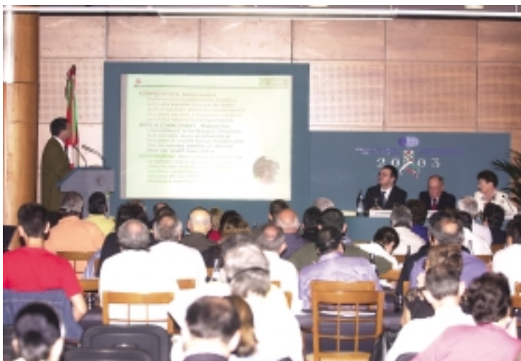
Los representantes de los centros vascos siguieron con interés las distintas ponencias presentadas en el Congreso.