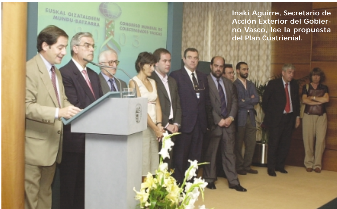
Iñaki Aguirre, Secretario de Acción Exterior del Gobierno Vasco, lee la propuesta del Plan Cuatrienal.

Tras cinco días de intenso trabajo, los representantes de las euskal etxeak que acudieron al Congreso de Colectividades Vascas presentaron unos documentos para elaborar una propuesta de Plan Cuatrienal que aparecen de forma íntegra en estas páginas.