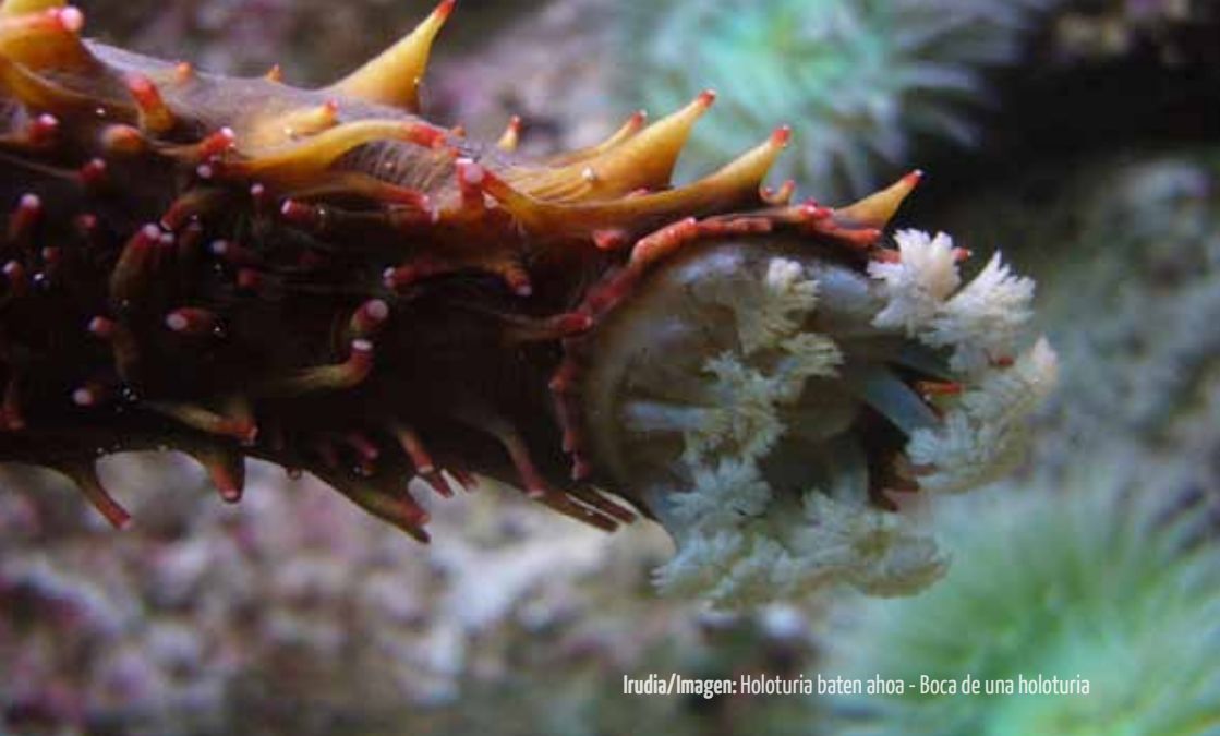
Irudia/Imagen: Holoturia baten ahoa - Boca de una holoturia