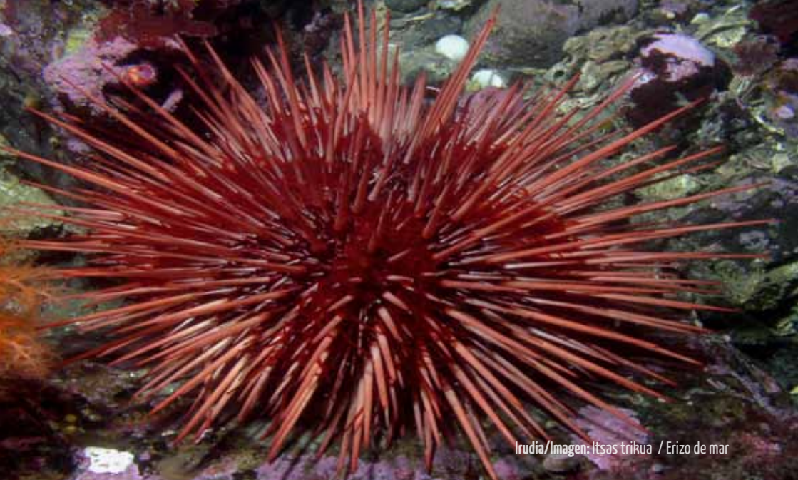
Irudia/Imagen: Itsas trikuia / Erizo de mar