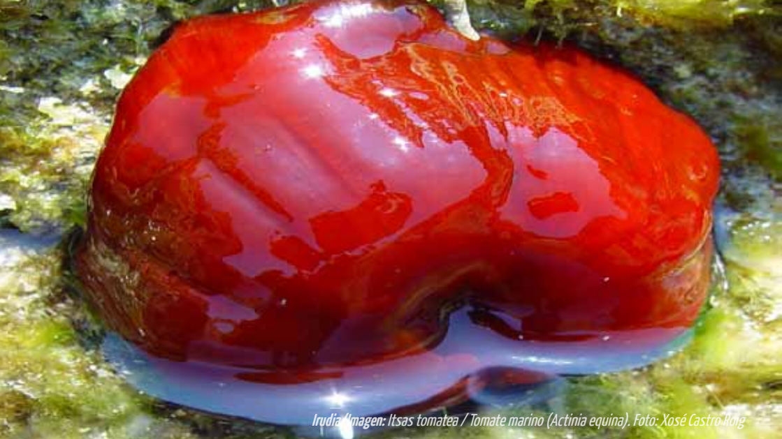
Irudia / Imagen: Itsas tomatea / Tomate marino (Actinia equina).