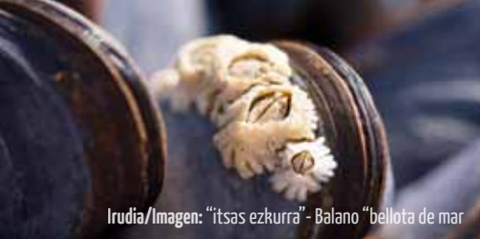
Irudia/Imagen: "itsas ezkurra" - Balano "bellota de mar"