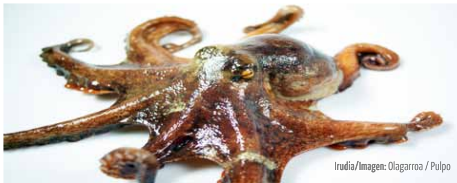
Irudia/Imagen: Olagarroa / Pulpo

Tanto univalvos como bivalvos se alimentan filtrando el agua y atrapando el plancton y los nutrientes en suspensión. Por este motivo crecen mejor en lugares con corrientes continuas, y en zonas donde abunda la materia orgánica en suspensión, como rías y estuarios.