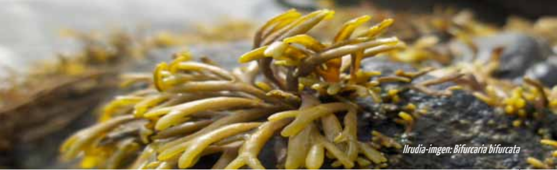
Ilrudia-ingen: Bifurcaria bifurcata