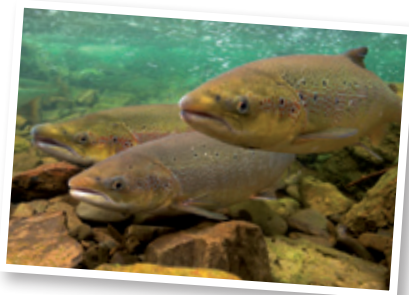
azterkosta monografikoak/monográficos azterkosta

Hala ere, badirudi izokin populazioa gorantz egin duela EAEn, batez ere Gipuzkoan. Hurrengo ibaietan aurkitu dezakegu: Bidasoa, Urumea eta Urola (gehienbat), eta Oria, Deba, Lea edo Oka (hain ohikoa ez dena).