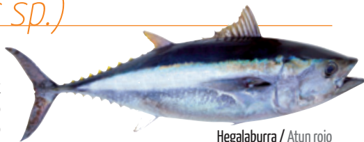
Hegalaburra / Atun rojo

Hegalaburrak aldiz, Ipar-Hego migrazioa egiten du. Mediterraneo itsasoko uretan erruten ditu arrautzak, eta udaberria heltzean