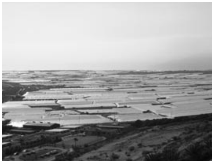
El Ejidoko paisaia: 14.000 hektarea hartzen dituen plastikozko itsasoa.