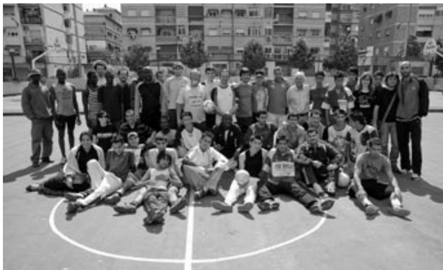
Bizikidetza eta kulturartekotasunaren aldeko jaialdi bat. Kirola, musika,... elkarguneak aurki daitezke nahi izanez gero.

neotasunaren onuraz ohartuta, hobe luke gizarte hartzaileak prestaturik –hezita– egotea biztanle autoktonoek etorkina haien identitatearen galgarritzat jo ez dezaten; bestela, beti argudio bila dabilzan xenofoboek ezin ordainduzko mesedea egingo litzaieke.