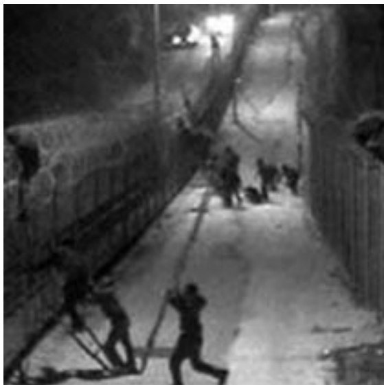
Melillako hesia: 17 km-ko hesiak bereizten ditu Melilla eta Maroko.

Ikusitakoaren arabera, Hirugarren Munduko herrialde guztiek bere baitan daramatzate, nolabait, Iparra eta Hegoa. Horrenbestez, testuinguru horretan eta ikuspegi horretatik aztertu behar ditugu hegoaldetik iparraldera doazen migrazio-mugimenduak oro.