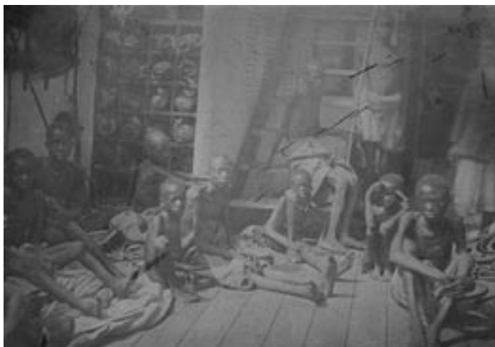
«Daphne» britainiar itsasontzian Portugal eta Espainiako tratulariengandik erreskatatutako ume eta gazte afrikar esklaboak. 1868ko argazkia.

Aro Modernoan, itsasoz haraindiko inperioak sortzean, Europako zenbait herrialdek bes-te kontinente eta lurralde batzuk kolonizatzeari ekin zioten. Sasoi hartan nabigazioan izan ziren hobekuntzek milioika lagun lekualdaketa ahalbidetu zuten, eta horrek ondorio bitxia ekarri zuen: Europako hainbat herrialde jendegabetuz zihoan bitartean, europarrek bere herri berri ugari fundatu eta populatu zuten munduko beste toki askotan; batez, ere Amerikan – mundu berrian –, non hasierako inbasioak eta ondorengo ekinek genozidio anker eta deitoragarria egin baitzuten.