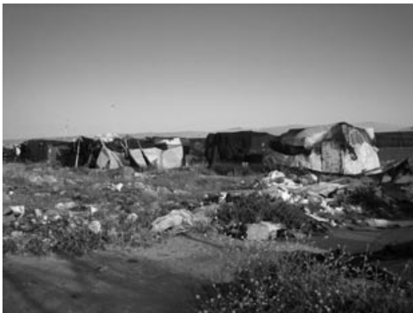
El Ejidoko berotegietan lan egiten duten beharginen txabolak. Ikus daitekeenez, modu jasangaitzean bizi izan dira, eta bizi dira oraindik, esplotazio-egoeran diharduten etorkinak.