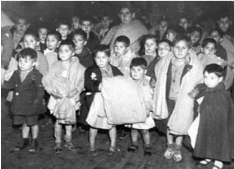
1939ko otsailean, Gerra Zibiletik ihesi, espainiar umeak Belgikarako bidean. (Gerrako umeak).

tzen ari den bezala– erakargune nagusiak: Madril, Katalunia, Asturias eta Euskal Herria. 1936ko Gerra Zibilak eten zuen mugimendu hura. Hala eta guztiz ere, garaileek ezarritako errepresioa medio, milaka lagunek ihes egin behar izan zuten Europako eta Amerikako herrialde askotara.