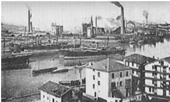
Bizkaiko Labe Garaiak 1896.

Europako industrializazioarekin alderatuta, euskal industrializazioa berantiarra izan bazen ere, XIX. mendeko hirurogeiko hamarkadatik aurrera, industria-gune garrantzitsu bihurtu zen Bizkaia; bai eta, espainiar estatu mailan, Katalunia, Asturias eta Malaga ere. Gipuzkoara, ordea, geroxeago heldu zen industrializazioa; baina Araban eta Nafarroan ez zen industria-alaketa nabarmenik izan XX. mendearen erdialdera arte. Bizkaiko meategiek betidanik zuten garrantzia izugarri handitu zen 1870. urtetik aurrera, bertako burdin harri, kalitate onekoa izateaz gain, lur arrasean ustia zitekeelako fama hartu baitzuen.