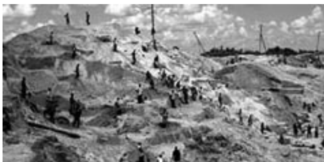
«Koltana eta Kongoa, Lehen Munduko krimena».