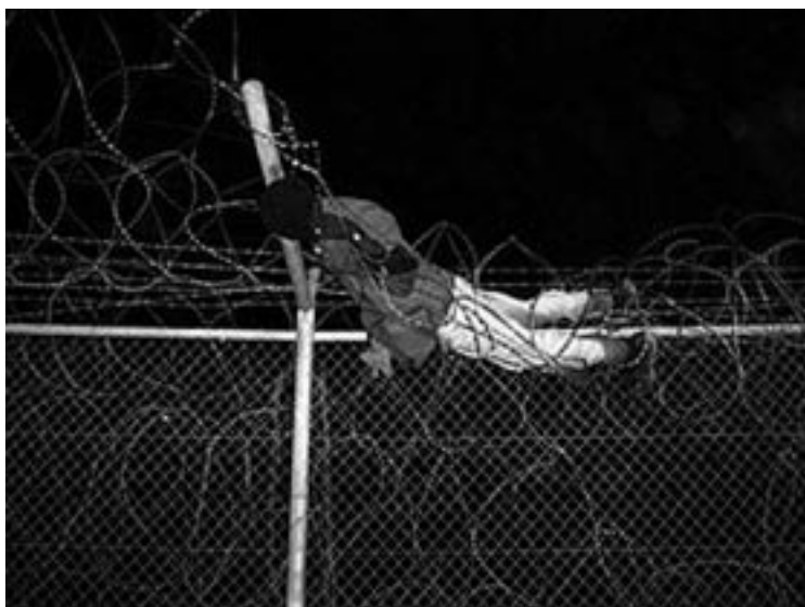
Ceuta, 2005. Mugako hesian harrapatutako gizona.

Nahiz eta langabezia hitza gero eta sarriago esan eta entzuten dugun, Mediterraneoaren iparraldeko herrietan lan-merkatua zabalik dago oraindik. Izan ere, herrialde horietan ez da falta izaten eskulan merkea eta malgua –etorkinak, gehienbat– bilatzen duen enpresabururik. Bestalde, ezin dugu ahaztu gure gobernuak ez ikusia egiten dioten ekonomia ezkutua ere atzeritik etorritako langilez hornitu eta elikatzen dela. Halako lan-egoeran dabilen etorkinak, noski, ezin dio muzinik egin ezein lanposturi, zeren kolokakoa edota klandestinoak izanik ere, lana izateak babesten baitu herri hartzailetik egotz lezakeen balizko agindu batetik. Behin lanposturen bat lortuta, errazago erdietsiko ditu kanpotarrak herri hartzailean bizitzeko eskubidea eta agiriak, paperak , alegia. Paper horiek –araupetze ofiziala– eskuratzeko itxaropena guztiz erreala da, beraz; eta itxaropen horrek bultzatuta, edozeri eutsi ohi dio geratzeko asmo argia duen etorkin orok.