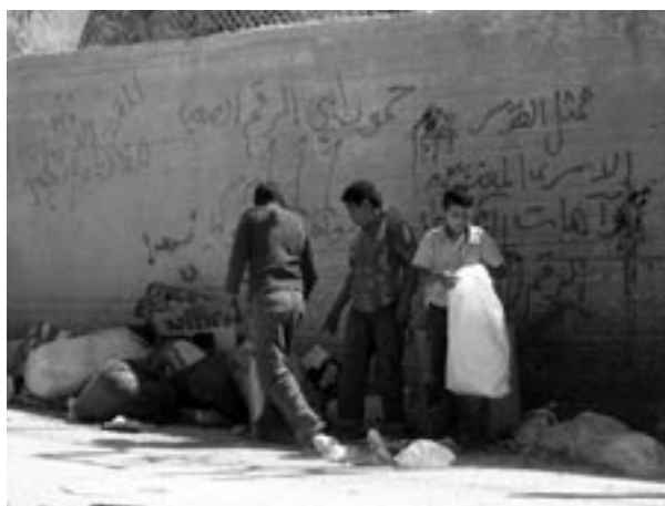
Palestinako umeak hormaren ondoan.

«Lotsaren horma». 2007ko uztaileko argazkia. Sionismoak palestinarrak kontrolpean edukitzeko altxatu dituen horma (700 km izango ditu) eta hesi elektrifikatuek palestinarren bizitza gero eta zailago bihurtzen dute. Ez dugu ahaztu behar 4 milioi errefuxiatu palestinarrak bere jaioterritik kanpo bizi direla (Jordanian, Sirian eta Libanoko errefuxiatu- eremuetan), sionismoaren indarkeria eta sarraskietatik ihes egiteko.