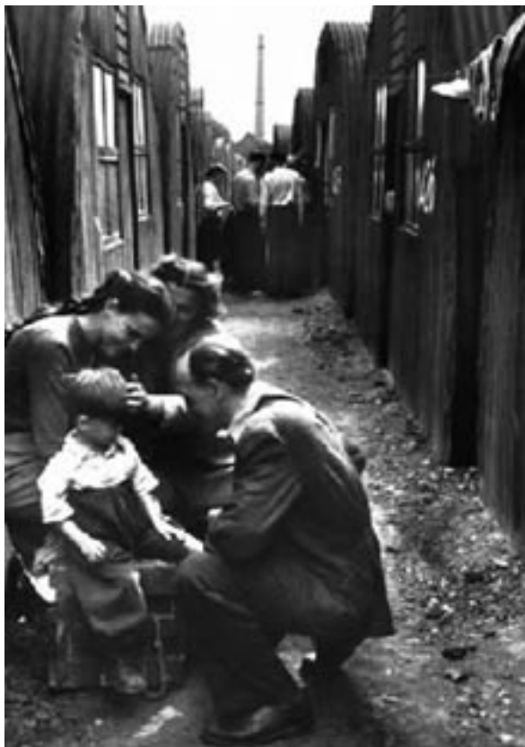
Bigarren Mundu Gerra bukatu zenean, milioika pertsona gelditu ziren etxebizitzarik gabe. Hona hemen Alemaniako esparru batean ostatua hartu zuten Europako ekialdeko familia batzuk.

Hamarkada berean (1936-1939) Espainiako Gerra Zibila gertatu zen. Jakinaenez, militar golpisten armadak garaitu, eta indarrean zegoen II. Errepublika deuseztu egin zuten. Garaipen hark eta ondoren ezarritako diktadura latzak 500 mila pertsona baino gehiagoren erbesteratzea eragin zuen.