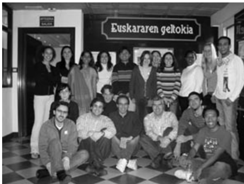
Kultura eta erlijioen arteko Elkarrizketari buruzko Nazioarteko Biltzarreko partaideak Euskararen Etxean (Bilbon, 2006ko abenduaren 13an).

Bi alderen eginkizuna denez gero, integrazioak –esana dugu– elkarrizketa du ezinbesteko tresna, eta hori sustatu behar dugu kultura ezberdinak elkar aditzera hel daitezten. Hala, etengabeko elkarrizketa baliatu behar dugu integrazioaren hobe beharrez. Baina ez bakarrik hezkuntzaren esparruan, baizik eta gizarteko eragile, udal, erakunde politiko, kirol-elkarte eta abarrek ere esku hartu behar dute etorkizun hurbilean sortuko diren arazoei aurpegi eta konponbidea emateko.