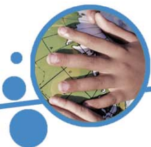
СХЕМА СИСТЕМЫ ОБРАЗОВАНИЯ

Учащиеся, которые заканчивают Обязательное среднее образование, получают титул “Закончившего Обязательное среднее образование”, что позволяет им продолжать обучение для получения степени бакалавра или в образовательном цикле среднего профессионального обучения.