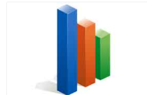
Inventarios y estadísticas