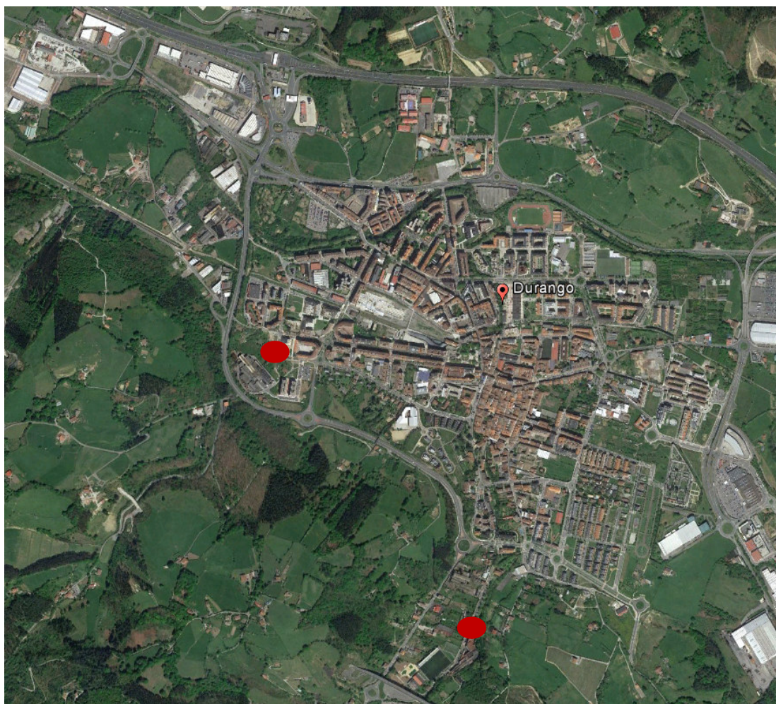
Imagen 1: Ortofoto del municipio de Durango y dos localizaciones de la Unidad Móvil.

En la siguiente ortofoto se detalla la localización exacta de ambos puntos donde se ha llevado a cabo las campañas.